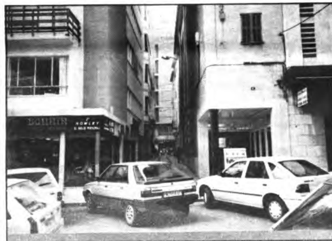
El tráfico, asignatura pendiente