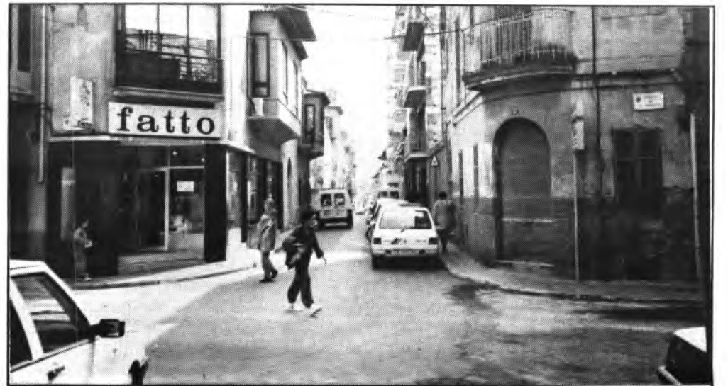
Fueron aprobadas distintas propuestas del Delegado de Servicios Sociales.

Finalmente el sábado, se efectuará una excursión al