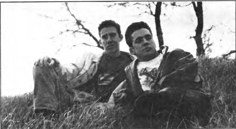
“Private Zone,” actuará en “la Noche del Deporte.”