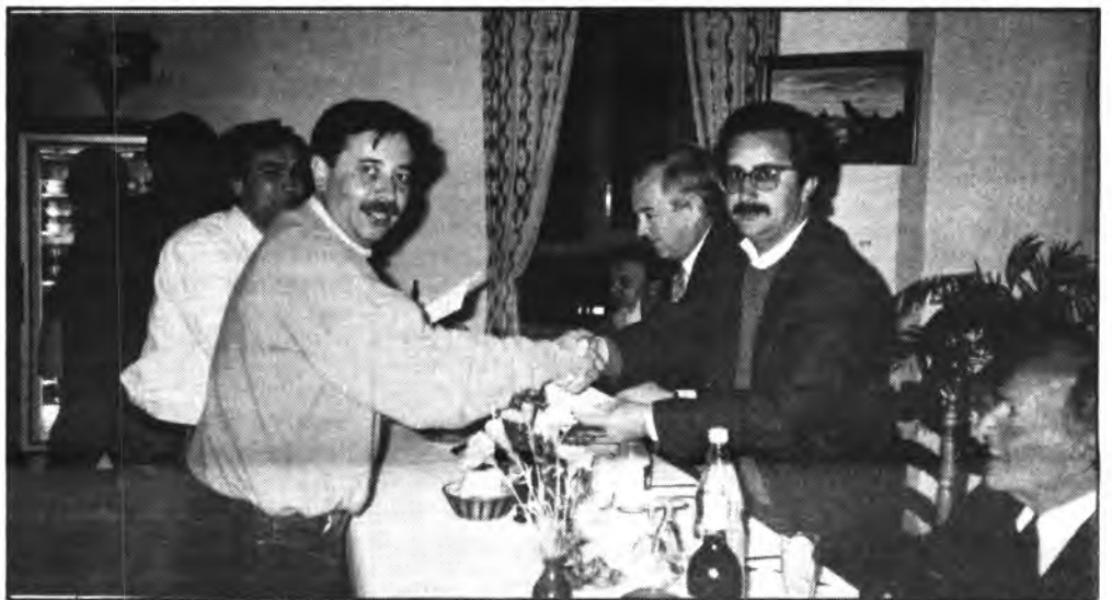
Los futuros entrenadores, recogieron su diploma..