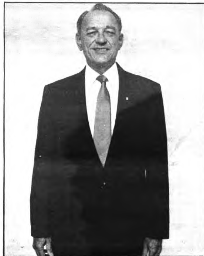
El Superior de la Salle. (Visitará Inca).

La Salle, en España cuenta con siete distritos. Inca, pertenece al Distrito Valencia-Palma, que cuenta con once mil doscientos alumnos.