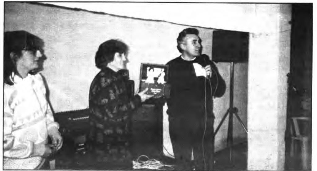
Cofre Antic, en la inauguración de su nuevo local, repartió obsequios y agradecimientos..