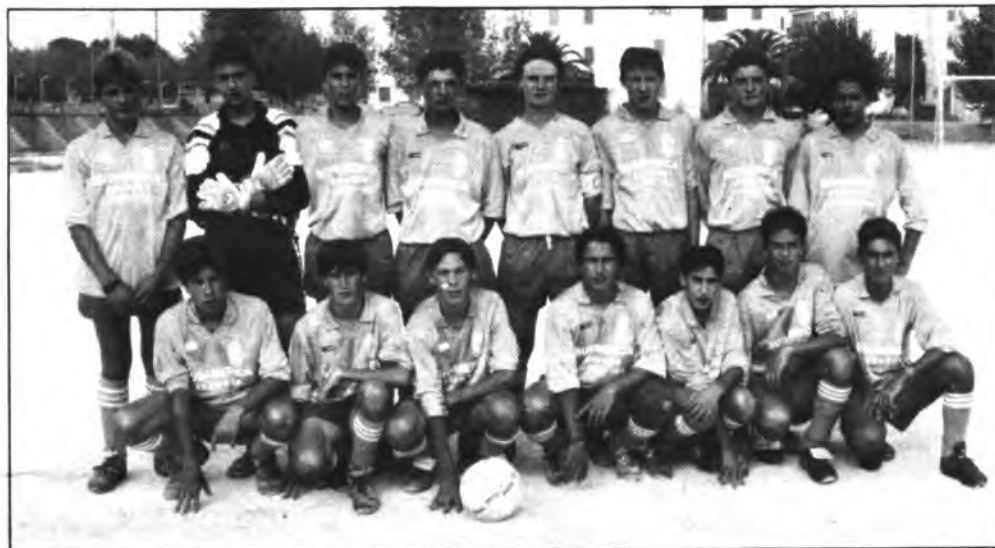
Equipo cadete del Bto. Ramón Lull.