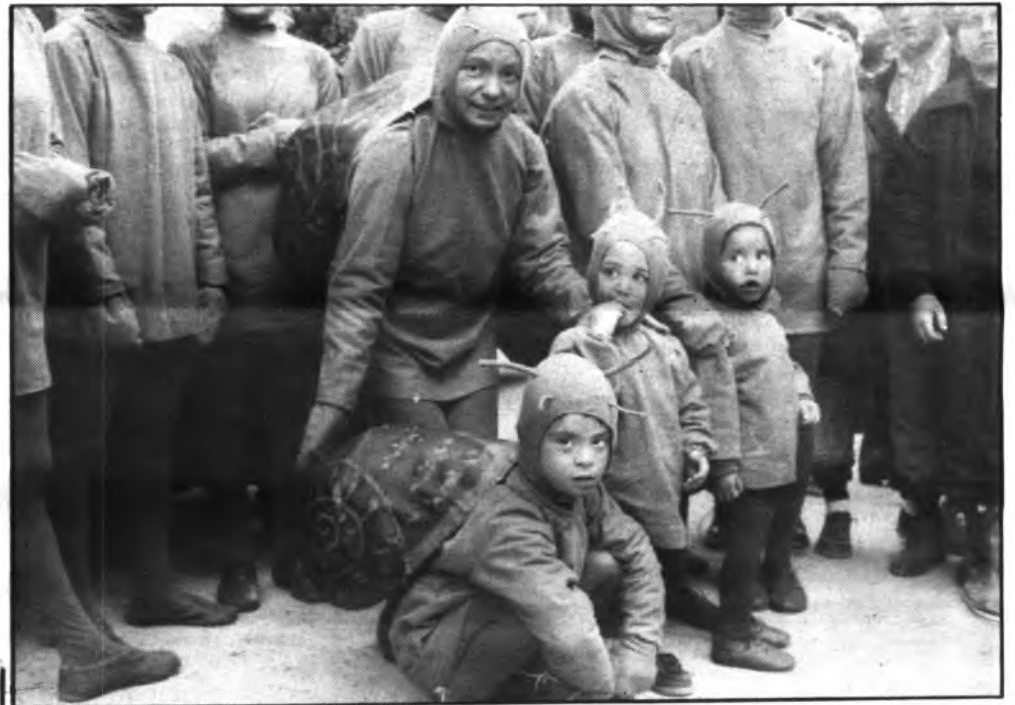
"Es Caragol Bover," protagonista del Carnaval.