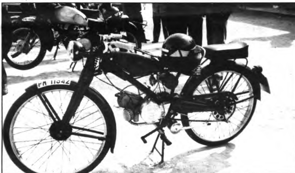
Proximamente, se celebrará la «Primera Muestra de Motos Antiguas».

SUSCRIBASE A «DIJOURS» ¡SIEMPRE ESTARA INFORMADO! TELEFONO: 504579.