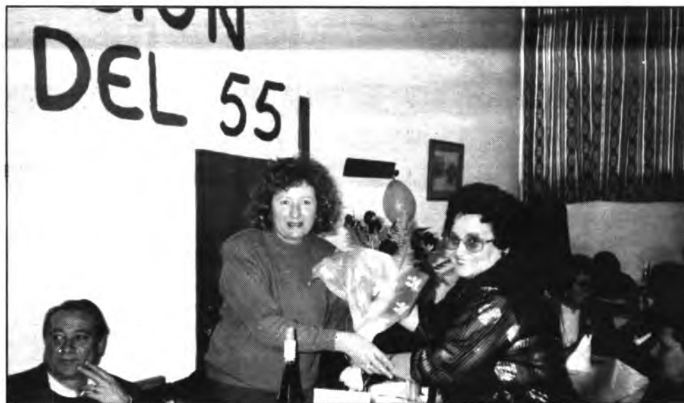
La primera dama de Inca, fue obsequiada con un ramo de flores en la fiesta de los mozos.