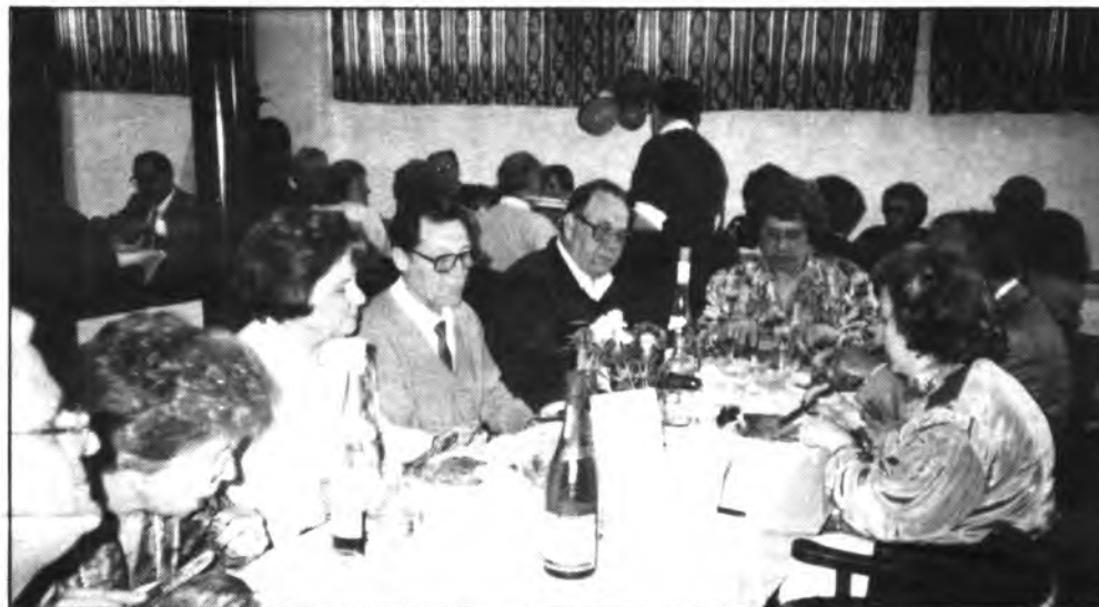
Cerca de setenta personas, participaron en la fiesta de los mozos del 55.

Según me dicen y me cuentan algunos componentes de la Asociación de Son Amonda, la potencialización del mercado de los domingos por la mañana y en sus distintas versiones, supone un gran esfuerzo económico y de trabajo. Toda vez que para que no decaiga el interés ciudadano por y para este mercado de verduras y mercadillo de obje-