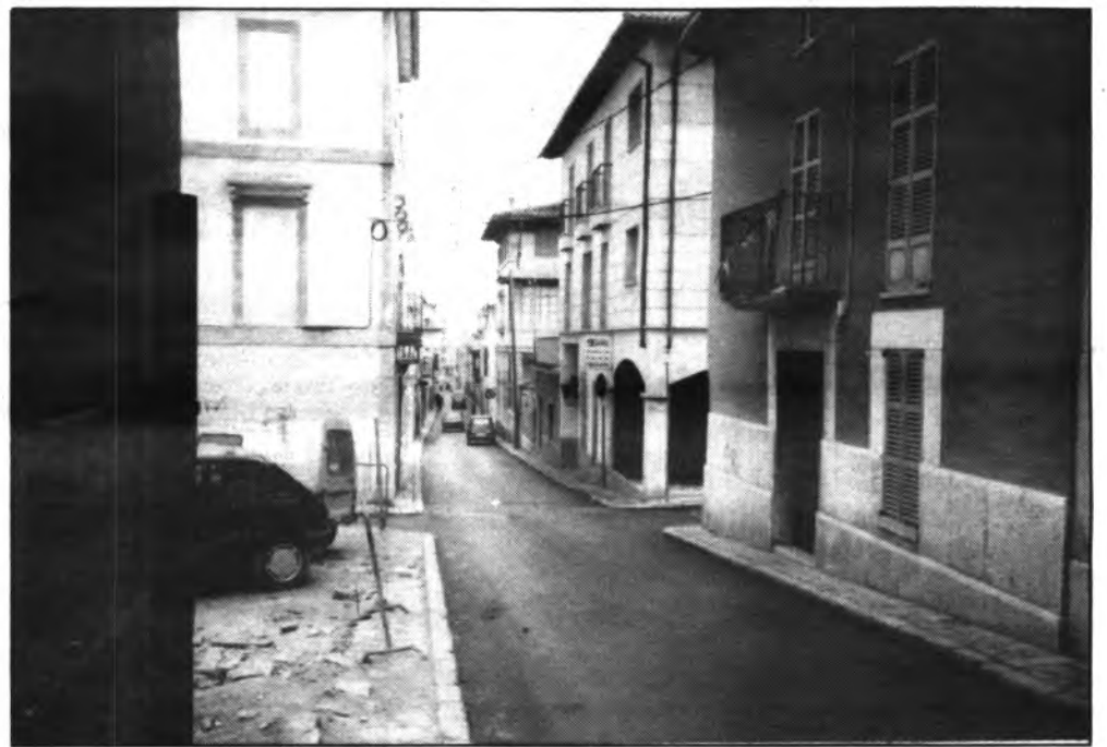
Inseguridad ciudadana, proporciones alarmantes en Inca.