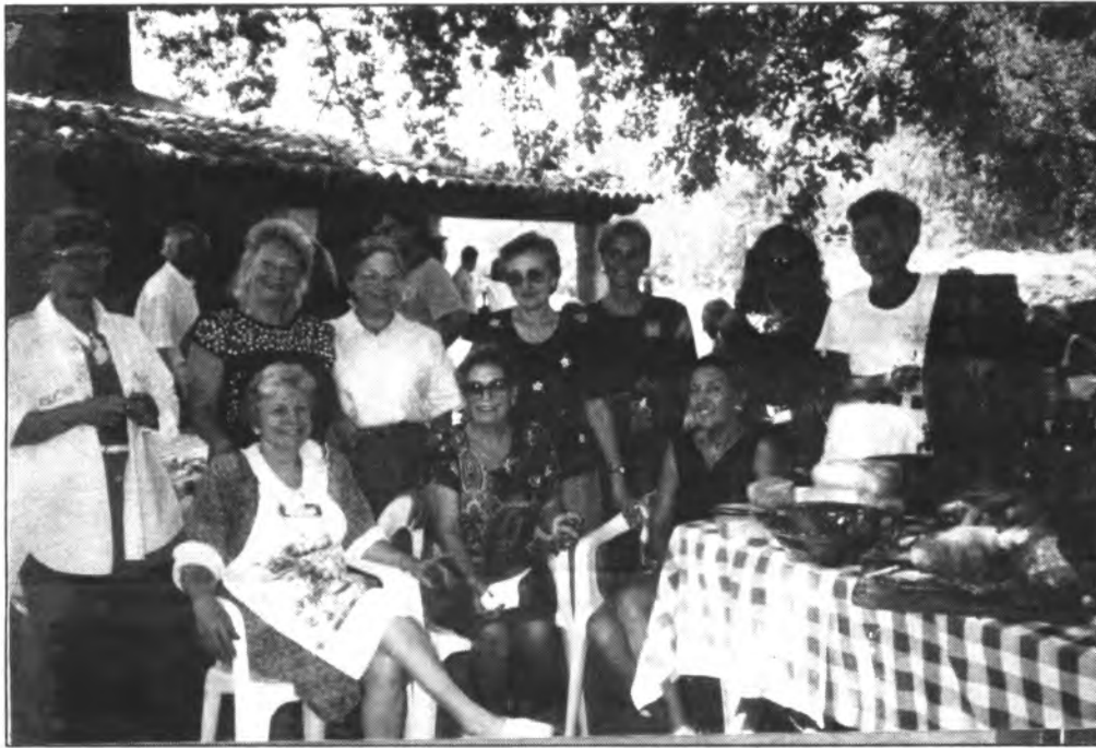
Masiva participación femenina en la Festa des Vermar.