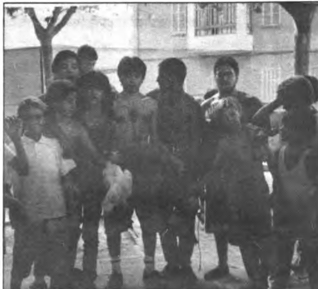
Participantes de la Pujada a L'arbre ensabonat con sus trofeos.

Igualmente, cabe destacar los distintos actos de carácter deportivo, Billar, Fútbol y Tiro al Plato, sin olvidarnos de los distintos juegos infantiles celebrados en la Plaza Des Blanquer con el tradicional PUJADA a L'arbre ensabonat, participando un elevado número de muchachos para hacerse con uno de los dos patos o dos pollos que en forma de