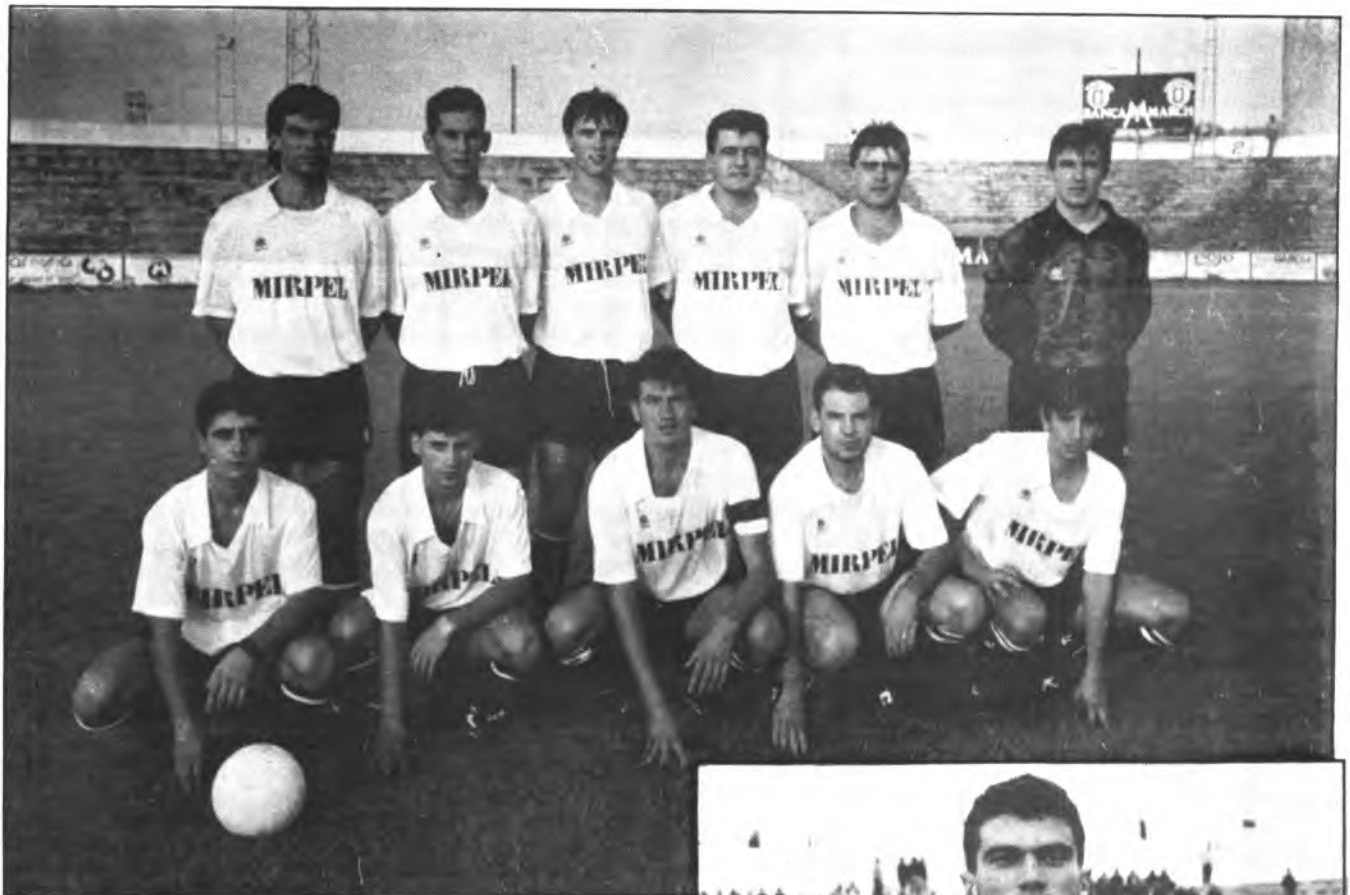
Equipo del Constanca que truncó la marcha victoriosa del equipo de LA VICTORIA.