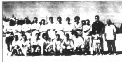
El Llosetense, por segunda vez, asume el riesgo de la Tercera División

AÑO VIII - NUMERO 98 - JULIO/AGOSTO 1991