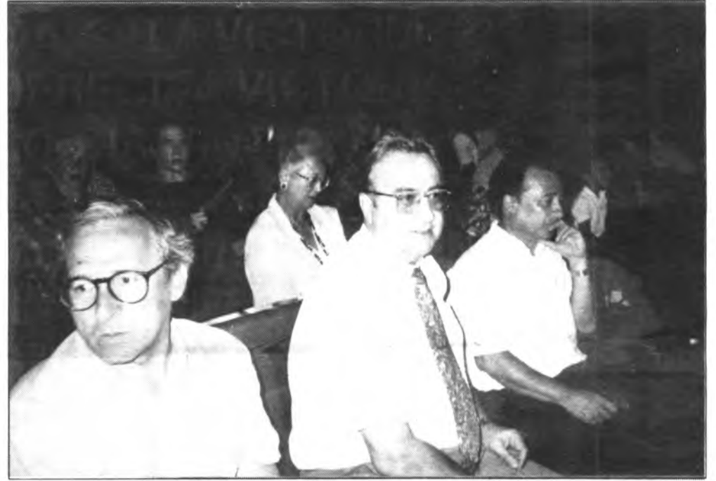
Se cumplieron los primeros cien días de la constitución del nuevo consistorio.