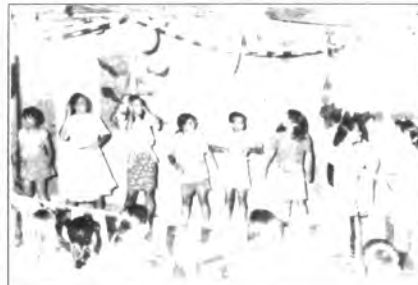
Estiu: temps de campaments