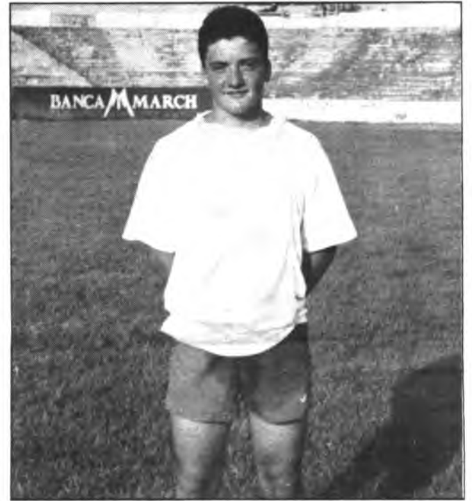
Tofol, incisivo delantero del Bto. R. Llull.

De todas formas, la ciudad de Inca, cuenta con unas entidades que saben encauzar a los jóvenes deportistas por los derroteros más convenientes en este complicado mundo futbolístico.