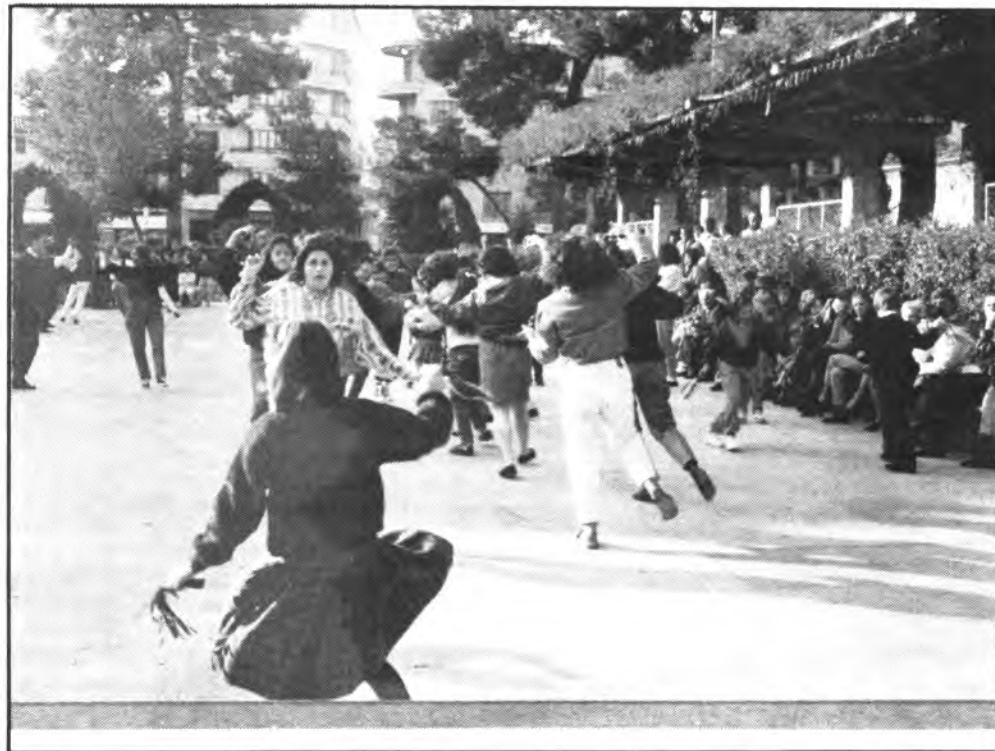
Masiva participación popular en la Gran Ballada del pasado sábado.