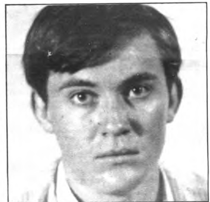
M. Mut, incisivo delantero del Constancia.