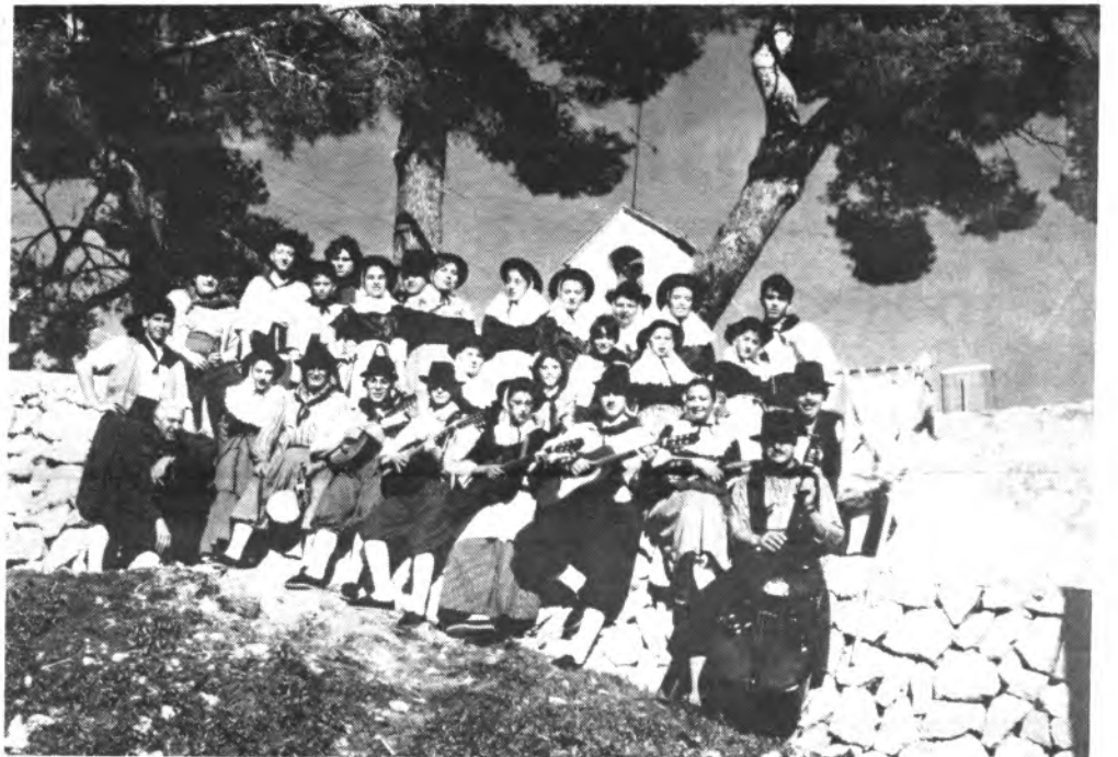
«Revetlers des Puig d'Inca», actúa este fin de semana en León.