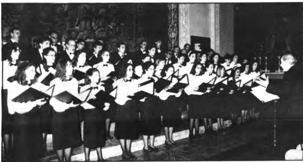
L'HARPA D'INCA, actuarà en Ibiza y Formentera.

La masa coral L'Harpa d'Inca, que viene escuchando merecidos y nutridos aplausos en todas y cada una de sus actuaciones, es noticia a nivel provincial, al anunciarse sus actuaciones en tierras de Ibiza y Formentera.