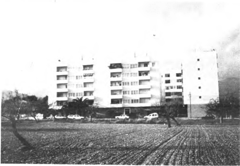
Las viviendas «Fernández Cela» celebrarán sus fiestas populares.