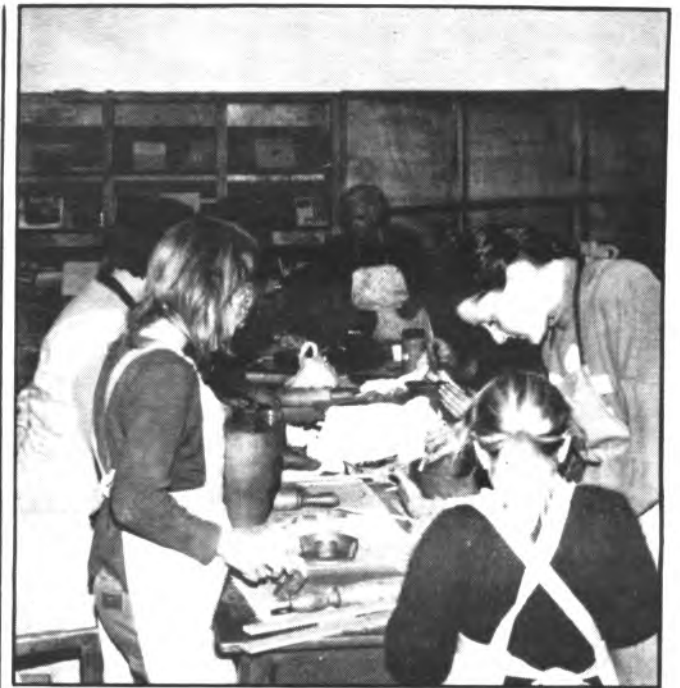
Las alumnas en pleno trabajo.