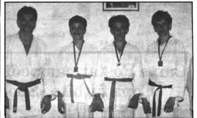
Los judokas inquenses, fotografiados junto a su entrenador.