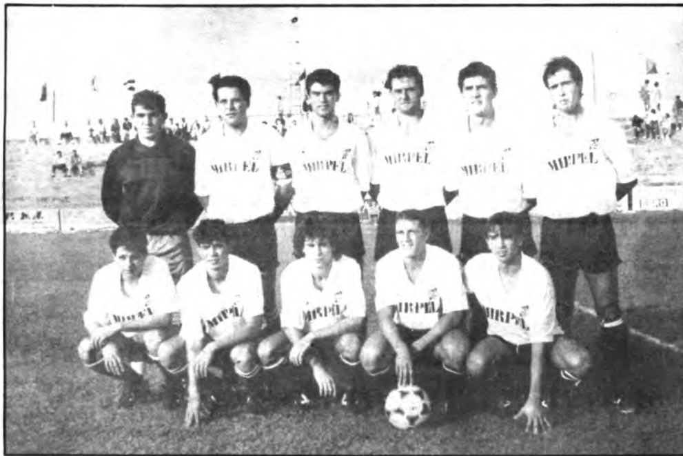
Equipo del Constancia.

En el aspecto goleador, el Sóller se presenta mucho más efectivo que el cuadro de Inca, toda vez que los de Sóller llevan materializados 38 goles por tan solo 29 el Constancia. Por lo tanto es evidente la superioridad