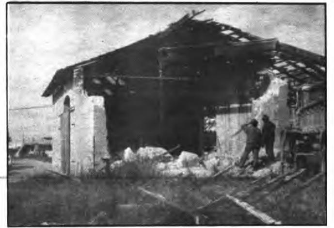
Lloseta: El antiguo almacén del tren que acaba de desaparecer.

de la calle Miquel Puigserver. Los vecinos de dicha calle han abonado el importe del valor de este inmueble que era propiedad de unos particulares. Por otra parte, el ayuntamiento correrá con los gastos de derumbe, alineación de la calle, así como de las aceras.