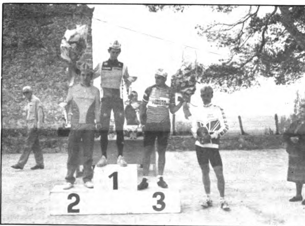
Cuadro de vencedores, "VI DIADA PUIG INCA".

por el Magnífico Ayuntamiento de Inca, bajo el patrocinio del Consell Insular de Mallorca, fue coordinada por el Club Ciclista de Inca.