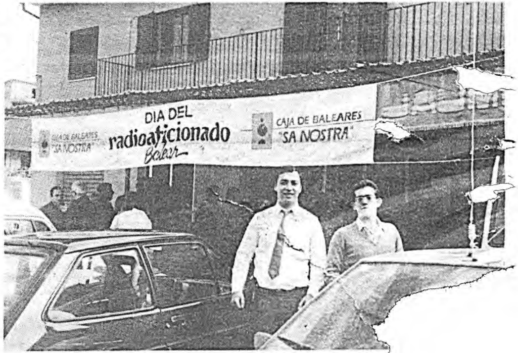
Los radioaficionados mallorquines, se reunirán en Inca

El programa de actos de esta jornada será el siguiente: a las 10 de la mañana recepción de Autori-