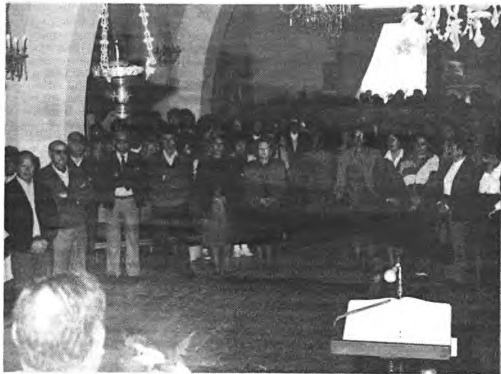
Un aspecto de la numerosa gente que se congrega en la romería.

nada superior hubo las tradicionales carreras de «joiés» que contaron con mucha participación.