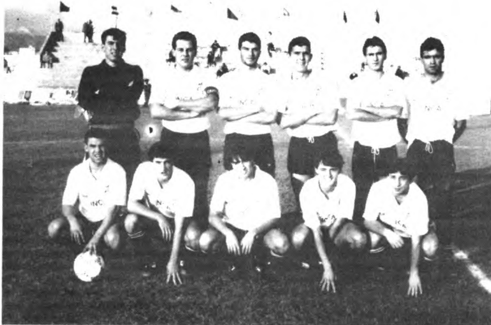
Equipo del Constancia.