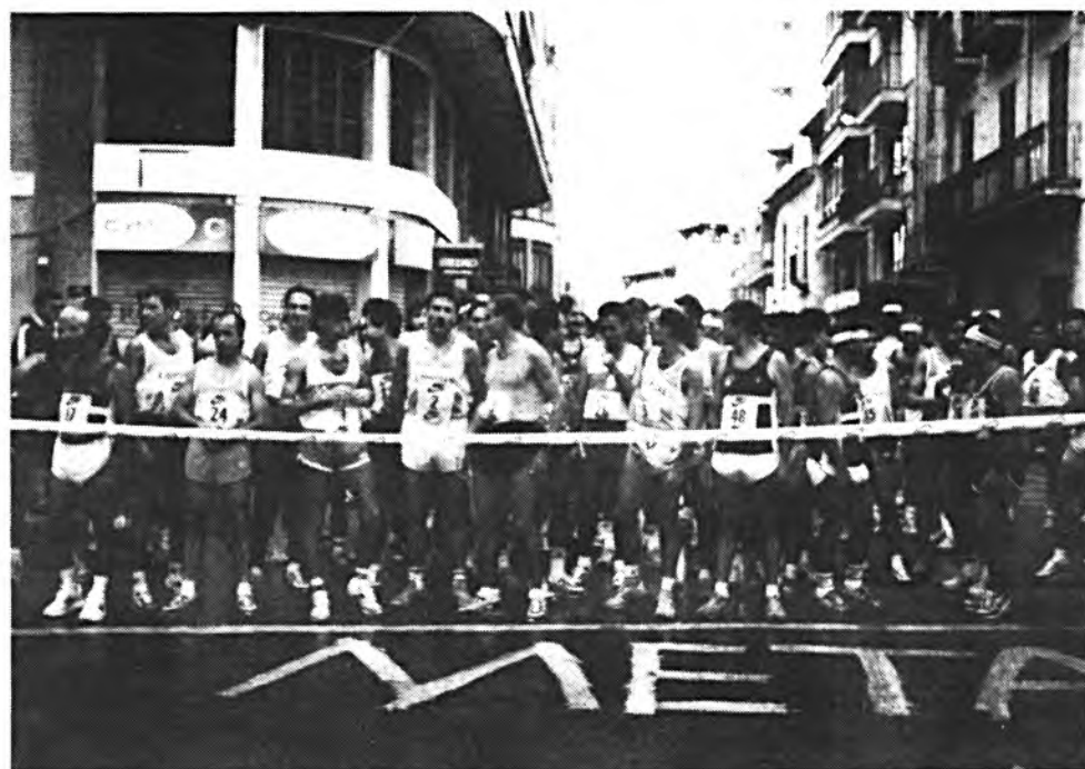
Se espera nutrida participación de atletas.