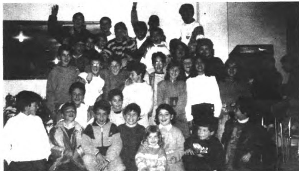
Fiesta grande para los muchachos del Alevin Sallista.

En un partido en el que el dominio correspondió en absoluto al equipo de Inca, el Beato R. Llull se impuso por un rotundo 5-1 al visitante de turno del Campo Municipal de Deportes. Siendo los autores de los tantos, Llobera (3), Fuentes y Feliu. Si bien, visto lo acontecido dentro del terreno de juego, los de Inca tuvieron oportunidades para poder incrementar esta cuenta. Mientras que el Margaritense en todo momento fue incapaz de superar el fuerte dominio a que