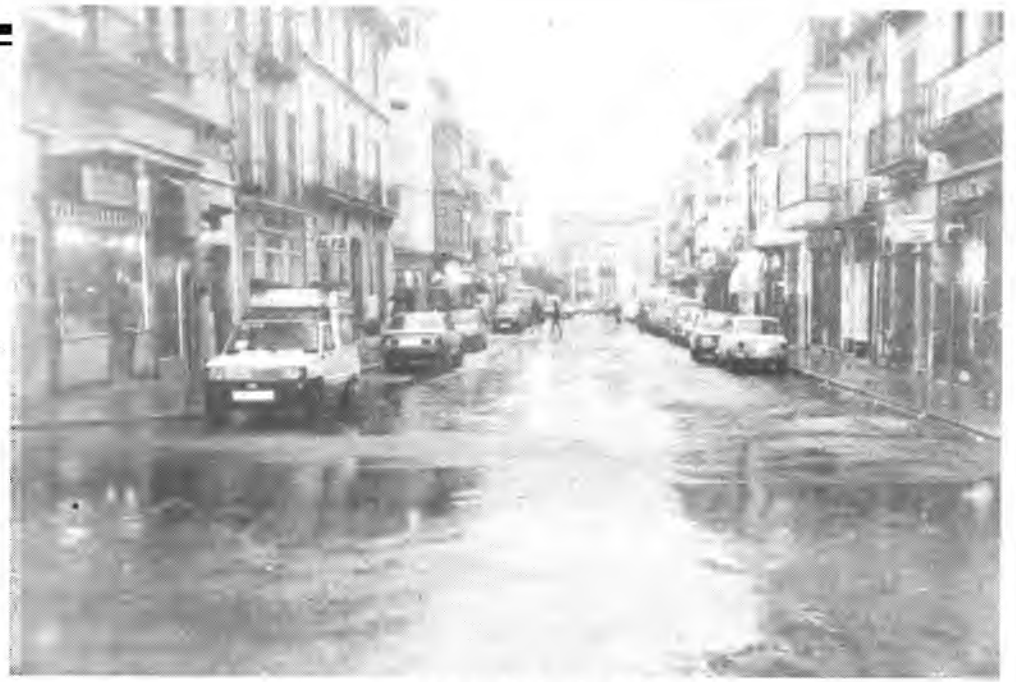
Los placers siguieron haciendo huelga. (Fotos: Payeras).

Se acordó la celebración de una próxima reunión que tendrá lugar el próximo lunes día 25 a las 4 de la tarde donde el alcalde de Inca Antonio Pons, con el