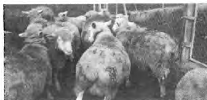
Detalle de los ejemplares de la «Illa de France».