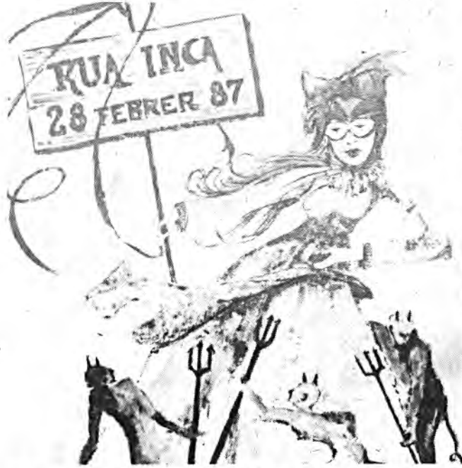
El carnaval prácticamente ultimado. (Foto: J. Riera).

El primer premio de las carrozas será de 20.000 pesetas.