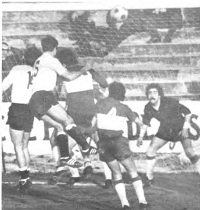
El Constancia dio un importante paso adelante.

La plantilla y entrenador son optimistas ante el partido de la máxima