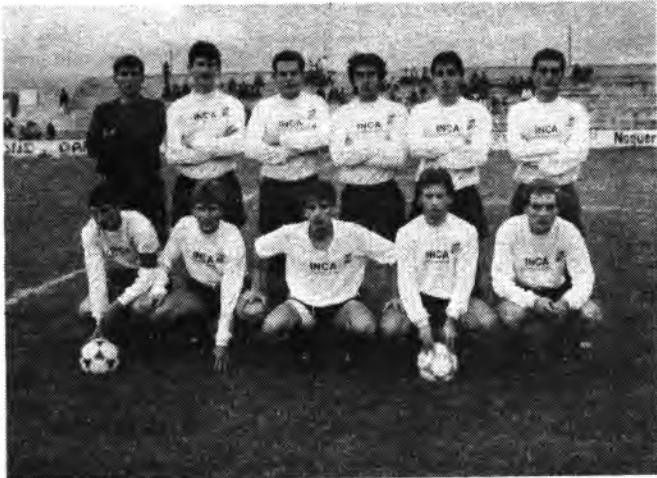
Equipo del Constancia.

Resumiendo, fallos y errores a go go, acompañado de un bajo nivel técnico, para una pobre actuación constanciera.