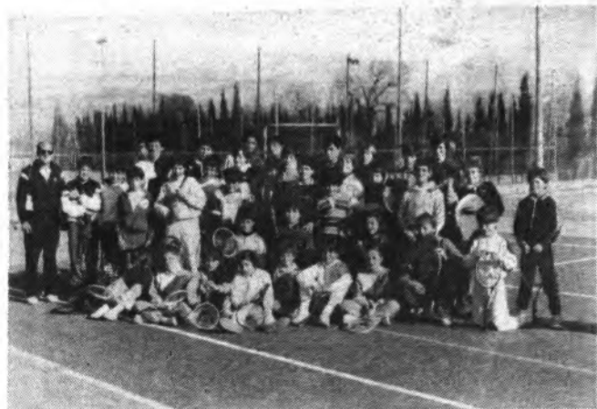
Miembros del equipo de tenis del Sport Inca.

Búger: 26 colegio Público de Lloseta: 24 Colegio Público "La Pureza" de Inca: 23 Colegio Público de Costitx: 23 Colegio "San Jaime" de Binisalem: 23 Colegio Especial "Juan XXIII" de Inca: 12 Colegio "Tesorero Cladera" de Sa Pobla: 11 Colegio Público de Santa María: 9 Instituto Formación Profesional de Sa Pobla: 2 Instituto Formación Profesional de Inca: 1 Descalificados: 1 TOTAL: 1.699 Actualmente el Jurado está procediendo a las calificaciones para conceder los 30 premios donados por la Dirección General de Deportes y "la Caixa".