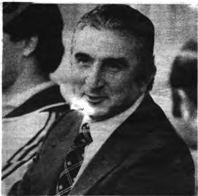
y don Miguel Muñoz.

¿Qué personajes serán los invitados en esta tercera edición?, a buen seguro, serán varios, y todos ellos con una personalidad más que reconocida.