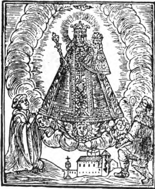
Devots, y devotas de nostre Señora de Lluc.

Escorca-Lluc, Inca, Lloseta, Mancor de la Vall, Moscarí i Selva.