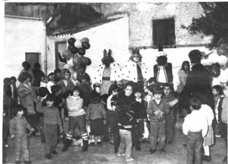
Los Reyes Magos en la Guardería Toninaina.