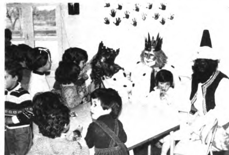
Departiendo con los chicos de Sol Ixent.

Un grupo de vecinos pretendió agredirles una vez detenidos