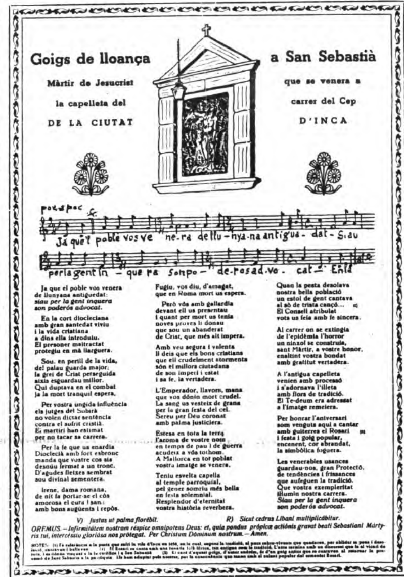
Detalle de la capilla en honor de Sant Sebastià.