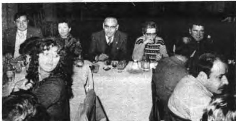
Mesa de honor de la fiesta de los bomberos.

Se brindó por el cuerpo y luego hubo una fiesta que se prolongó por espacio de unas horas.