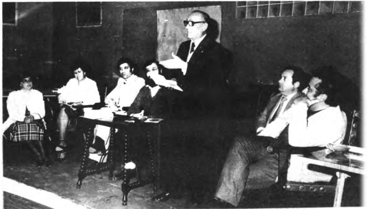
a las nuevas generaciones inquenses. El Aula de la tercera

Un acto sencillo que sirvió para acercar el libro a nuestros mayores, al tiempo que se les animó para que ellos fomentasen la cultura y las tradiciones locales