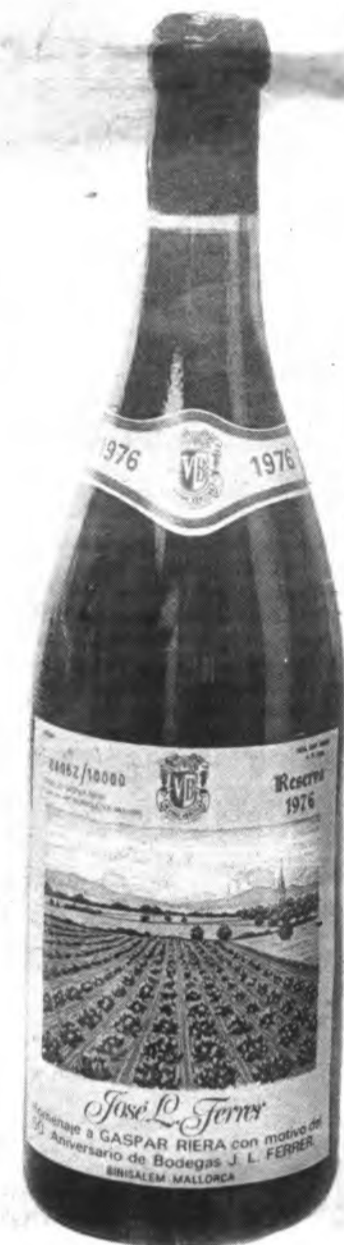
que sin duda gustará a los aficionados.