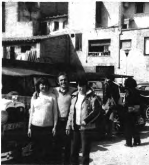
NEUTRALITZACIO I CONTINUACIO