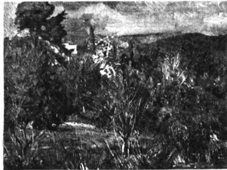
Paisaje de Rody.

Grau Elemental: Dilluns i dimecres de 8'30 a 9'30 del vespre. Grau Mitjà: Dimarts i dijous de 8'30 a 9'30 del vespre.