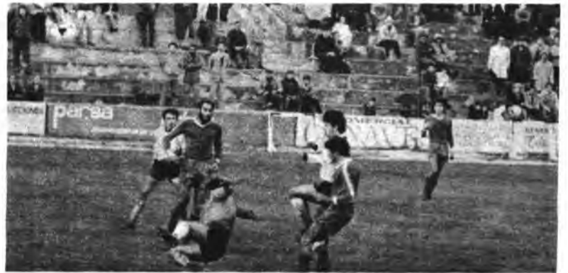
¿Conseguirá el cuadro blanco puntuar?

El Constanca logró con más apuros de los previstos anotarse el triunfo ante el Calviá, que consiguió llegar al descanso con ventaja de 0-1 a su favor, pero parece que las segundas partes son propicias a los jugadores inquenses, ya que en muchas ocasiones han conseguido en este período conseguir la victoria. Cuando hacemos la presente información desconocemos el resultado del partido de copa, que se jugaba el día de Reyes por la tarde en el "Nou Camp" ante el Castilla.