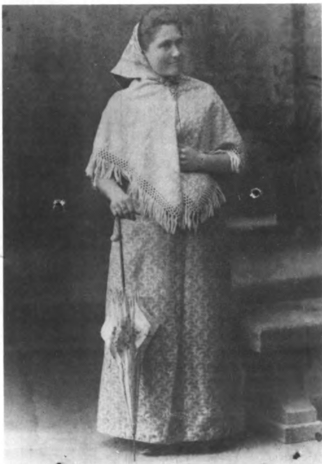
VESTIMENTA PRÒPIA DELS ANYS 10