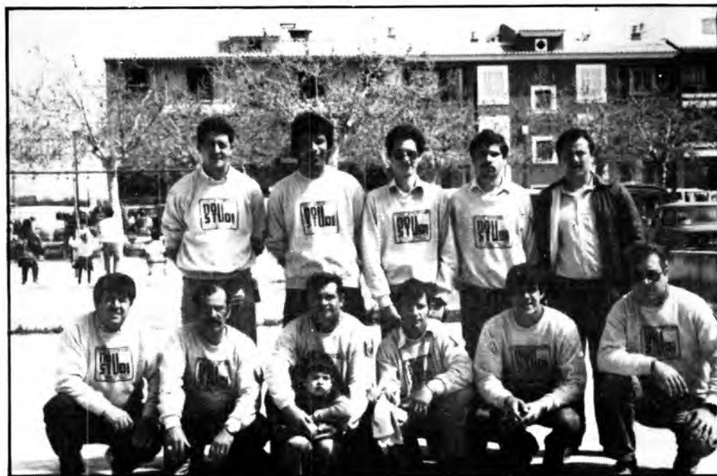
Formació del Club Petanca Villa Santa Maria

El fet que apuntàvem a l'inici d'aquest escrit, que la petanca és poc coneguda, fa referència a que és un esport amb escassa transcendència a nivell informatiu en els medis de comunicació. Nosaltres mateixos, la revista "Coanegra", hem d'entonar un "mea culpa" i reconèixer que fins ara hem ignorat pràcticament els petanquistes de la