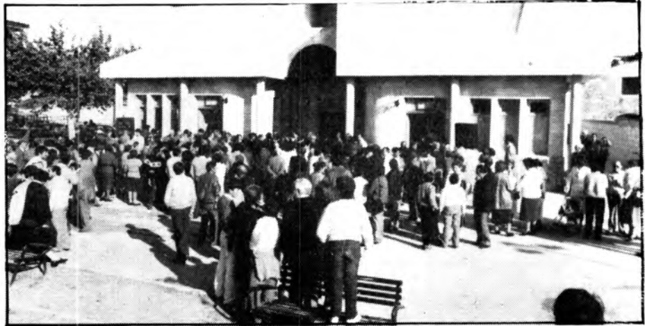
Una gran multitud de santamariers va anar a la inauguració

10.000. Al llarg d'aquest reportatge hem expressat algunes opinions i suggeriments que sentírem a la gent santamariera. Tot sia per aconseguir una fira més de tots els santamariers i més participativa. Recuperant com aquest any el caràcter ramader i agrícola, ja cap a races pròpiament mallorquines. La fira com a tota activitat, sempre es pot millorar, superant els defectes i errors. De tota manera fira.