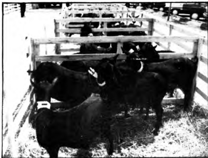
El concurs de cabres murcianes comptà amb molts de participants.

També cal remarcar que el ressò de la fira als "mass media" ha estat molt gros, ràdio, a la TVE-Balear, dos especials de quatre planes (a l'Última Hora i a El Dia de Balears), la qual cosa contribuï a fer conèixer i visitar la nostra fira. També aparegué publicitat a la revista "Sovint", costant més de 70.000 ptes. una plana, i per contra a l'única revista local no se'n feu gens.