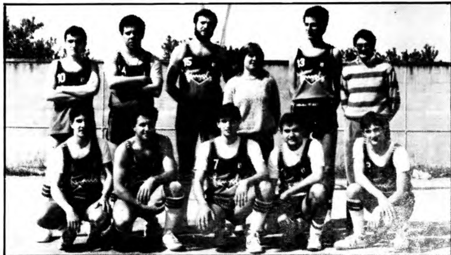
Equip Senior masculí

Aquestes darreres setmanes la majoria dels equips han acabat la temporada, de fet ja només queda en competició l'infantil masculí, i si en aquests moments haguéssim de fer balanç de com ha anat aquest any, pot esser ho poguéssim fer des de dos punts de vista. En el de participació ha estat molt bo ja que hem tingut set equips en competició que suposa uns 80 jugadors i set entrenadors a més d'un caramull d'hores d'entrenament i de partits. En el de classificació no hi ha hagut tanta de sort, ja que cap equip ha aconseguit quedar situat en els primers llocs.