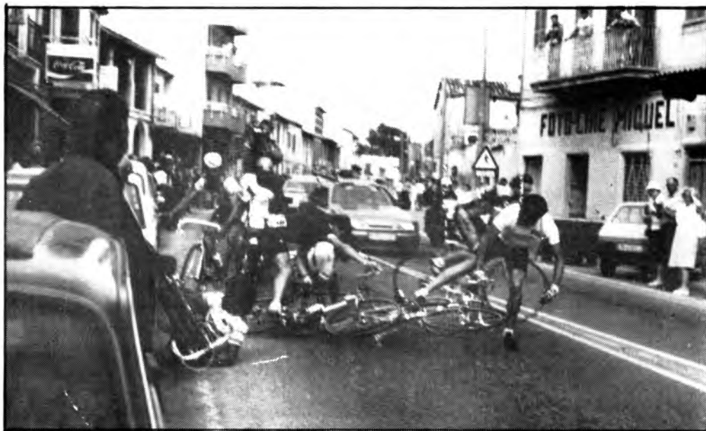
Hi ha moments en què és difícil aguantar l'equilibri damunt la bicicleta. L'oportuna fotografia de Pere Bosch ens ho demostra

Anècdotes, coses i coses no solen faltar en aquestes enormes organitzacions. D'entra elles podem destacar que un corredor, que al·ludint a la seva pressa explicava que era per poder tenir temps de comprar perles a Manacor i guanyar l'etapa. Com a coses curioses, cal destacar —i quines coses passen a Mallorca— que els lladres sempre estan a punt, ja que robaren els àrbitres i cronometradors tots els seus aparells corresponents de dintre els seus cotxes aparcats al Passeig Marítim de Palma, quina no fou la seva cara d'esglai i sorpresa!. I no quedà més remei a l'organització que anar a les totes a comprar els aparells necessaris per a poder realitzar la prova, i un bon cas fou el del poc aventurat corredor que a "Sa carretera" de Santa