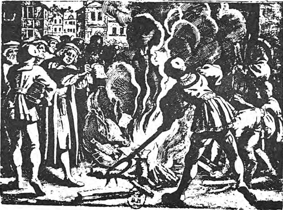
Martí Luter crema la butlla papal en què Lleó X l'amenaçava d'excomunió

terior al Papa apel·la per passar "d'un Papa mal informat a un Papa millor informat". Però la disputa de Leipzig amb el teòleg Eck, l'estiu de