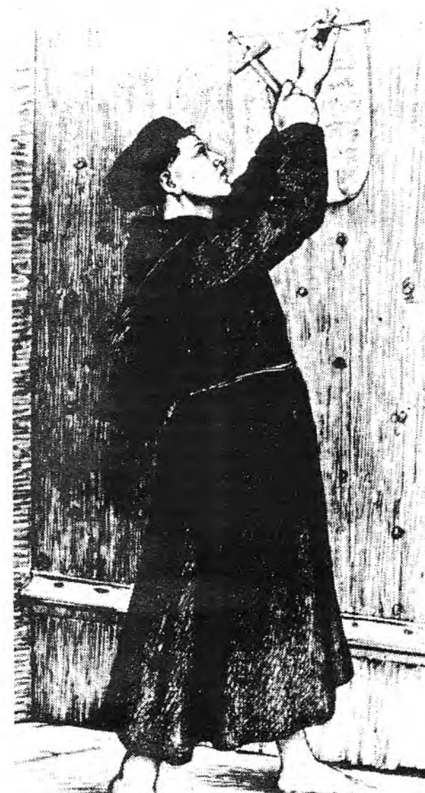
Martí Luter fixant les 95 tesis a la porta de l'església del castell de Wittenberg

Per altra banda, els enemics i contradicadors de Luter també l'empenyen cap a un enfrontament amb l'Església oficial. Quan a la tardor de 1518 Luter s'entrevista amb el Cardenal Cayetà, enviat del Papa, encara es mostra un fill respectuós de l'Església i en una carta pos-