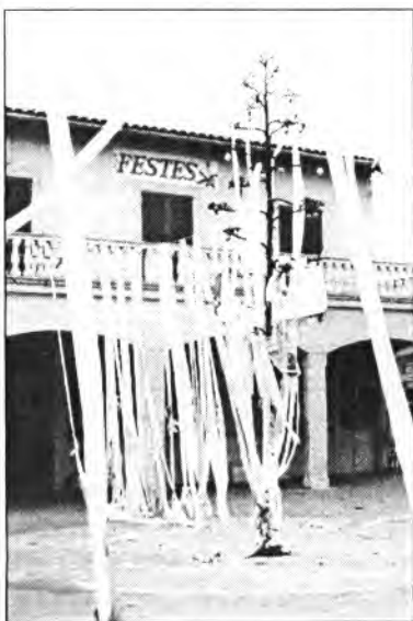
Altres anys s'han vist innocentes de més o manco bon gust, com aquests dues dels Innocents de 1990 (a l'esquerra) o de 1996 (a la dreta). Ambdues satisfieren una bona part del poble