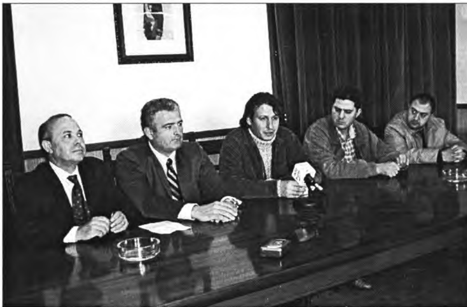
El Conseller Font amb el batle, el Director General de Recursos Hídrics i dos regidors

Una d'elles fa referència a les inundacions que es produeixen a l'entorn del camí Pelut quan plou en abundància. El jac del torrent que passa al seu costat no és suficient per conduir tota l'aigua i per altra part en arribar a la carretera de Manacor, encara s'estreny més en passar per davall, i això fa que allà es formin els llacs dels quals anys enrere ja n'hem publicat detallada informació gràfica. Amb el conseller es va decidir que el jac del torrent en tota la seva extensió, en el ram des de Sa Corona fins a la carretera s'ampliï fins a dos metres d'amplària i dos de profunditat i en esser a la carretera, fer un pont per davall amb les mateixes mides i així l'aigua podrà esser absorbida