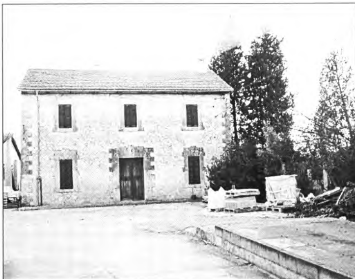
Així es troba avui l'edifici que era l'estació del tren de Montuiri. De les vies no en queda res