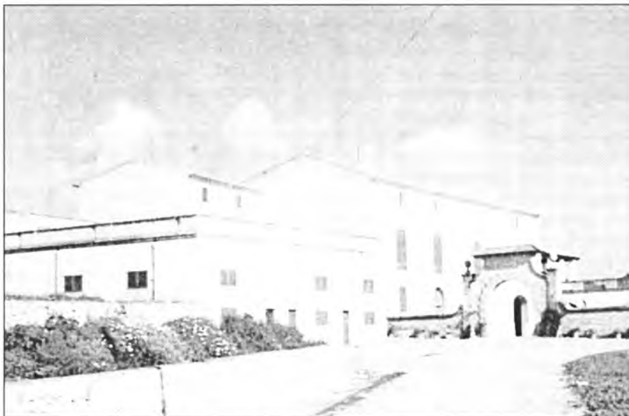
En el segle XVIII Son Company ja era una de les grans possessions de Montuïri

Pel que fa a l'activitat industrial, el desenvolupament de l'agricultura hi generà una indústria dedicada a la transformació de productes agrícoles. El 1830 hi havia 18 moliners de vent, 9 picapedrers, 9 fusters, 6 ferrers, 3 taverners, 3 botiguers, 3 teixidors de lli i llana, 3 sabaters, 2 hostalers i 1 cerer. Durant aquest centenni també es documenta al coll de sa Grava l'extracció d'aquest material. L'arxiduc Lluís Salvador d'Àustria qualificà la