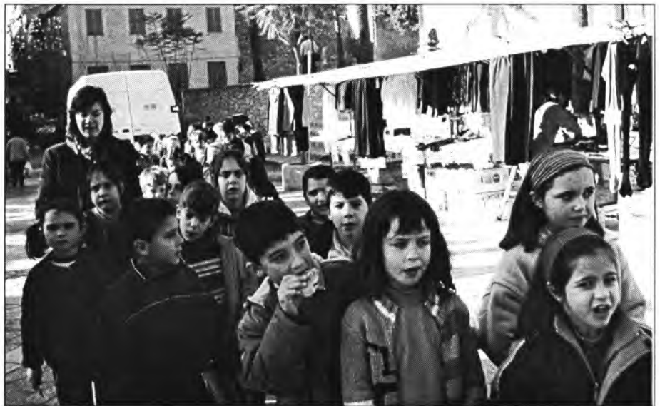
Els alumnes de les Escoles de tant en tant visiten el mercat del dilluns

Si l'any passat començarem l'any amb 2.600 habitants, enguany l'hem iniciat amb 2638, o sia amb 38 més i això que el 2003 es va tancar amb un dèficit de 10 persones respecte al nombre de naixements i defuncions. Per tant l'augment prové de persones d'altres indrets vengudes a empadronar-se a Montuïri.