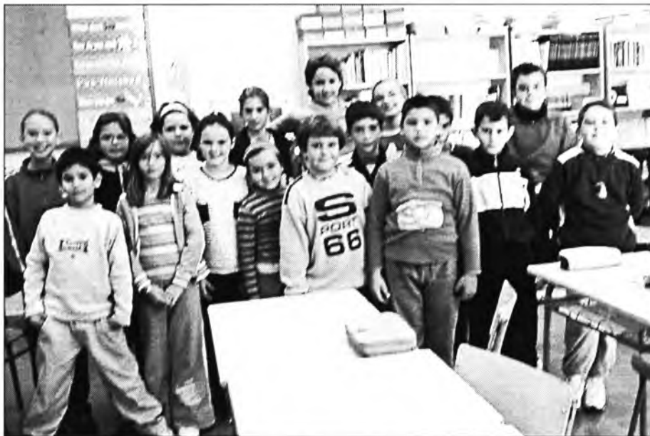
Els alumnes de 4t curs de primària del Col·legi "Joan Mas i Verd" aturaren un moment les activitats per fer-se aquesta foto

El qui va ésser Vicari de Montuïri des del 19 de juliol de 1953 fins el 8 de desembre de 1956 va morir dia 1 de gener passat a Ciutat. La gent del poble, d'edat, encara el recorda per la seva bonhomia i senzillesa. De Montuïri anà com a rector de Pina i