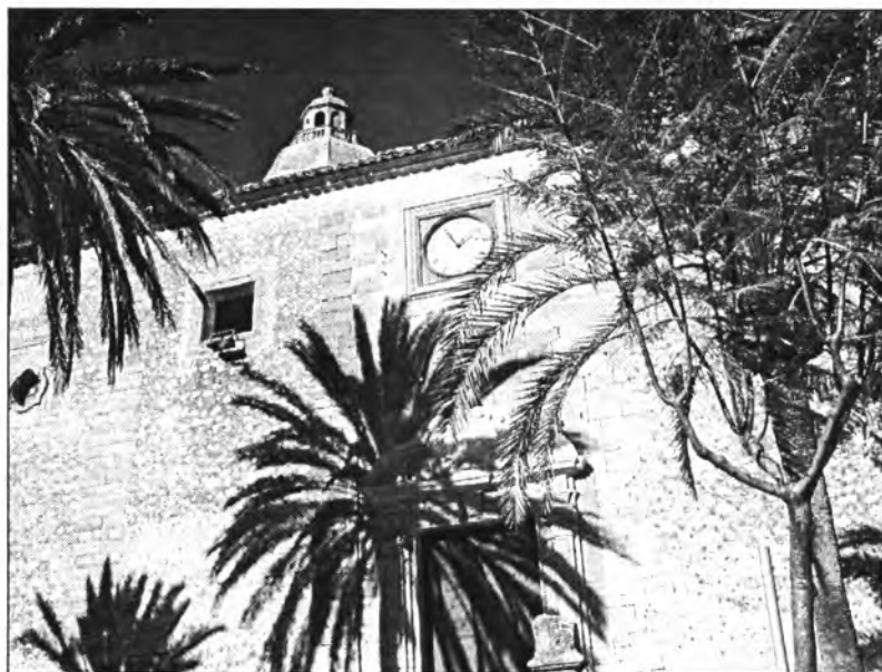
A finals del segle XIX, era el 17 d'octubre de 1893, va romandre col·locat el rellotge a la façana de l'església

Al final del s XIX i al començament del s XX es va produir un gran canvi en l'estructura agrícola de la contrada amb l'establiment d'algunes grans finques, com Son Castanyer, Son Company, Son Costa, Son Cucuí, Galiana, Mianes, Sabor, Tagamanent, Son Toni Coll i Sa Torre. A l'hora que augmentaren el nombre de petits propietaris, també es produïren millores a les tècniques agrícoles i s'introduïren nous cultius, com l'ametler. Aquest tipus de conreu era molt rendible, es podia combinar amb la ramaderia i permetia l'aprofitament de les terres marginals. Al principi del segle XX, l'agricultura era una peça clau de l'economia i continuava essent el sector predominant.