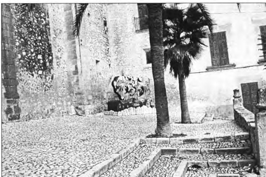
La rampa d'accés als graons és una de les millores previstes per enguany