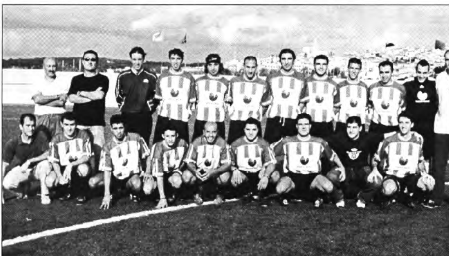
Enguany l'equip de 2ª regional torna destacar dins la seva categoria