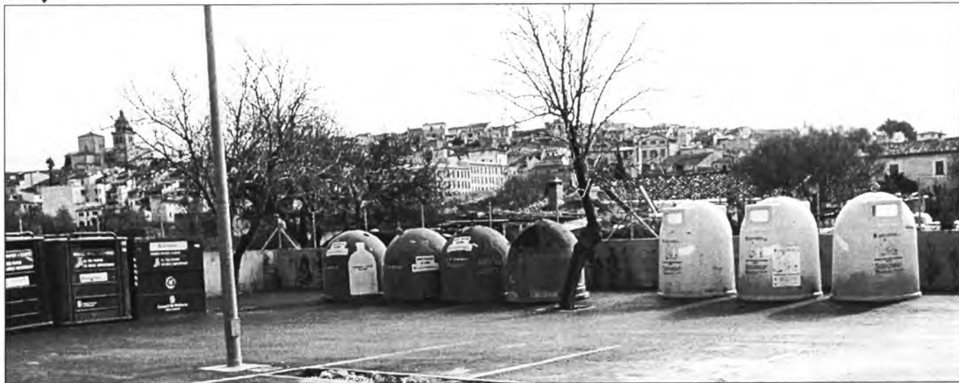
En el Parc Verd s'hi troben contenidors classificats per a tot tipus de residus orgànics i inorgànics