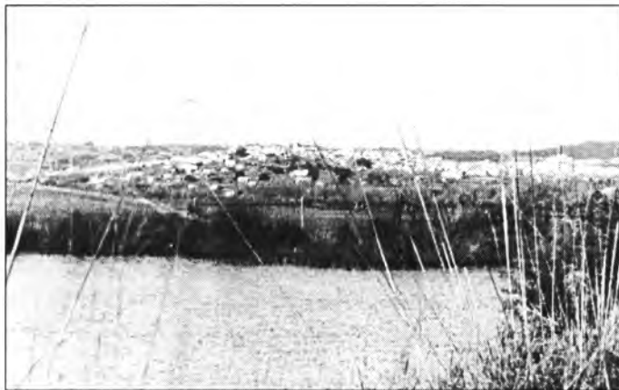
Des de l'estany o llac d'Alcoraia, a l'esguard de les cases de Montuiri, s'atalaien també indrets molt suggeridors

més en penombra, hi havia un infant que corria cap a les síquies. Parlava en veu baixa amb sa mare, per no espantar les aus. Aquell dia hi havia llum i tot era verd. Ara no els hi veureu, però segur que encara hi són.