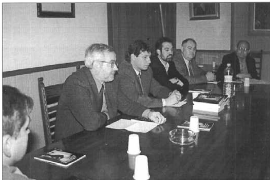
La presidència a l'acte de presentació del llibre de VIII Concurs de Conte Curt ↑ i una vista del públic assistent ↓

El dia de Pasqua la tradicional "Encontrada" va arrebregar molta gent. De bell nou al portal de Can Socies es toparen la Mare de Déu (amb els tradicionals botets) i Jesucrist Ressuscitat. En acabar la processó, un ofici solemne tancava els actes religiosos. I a la sortida es va poder gaudir d'un concert ofert per la banda de música a plaça.