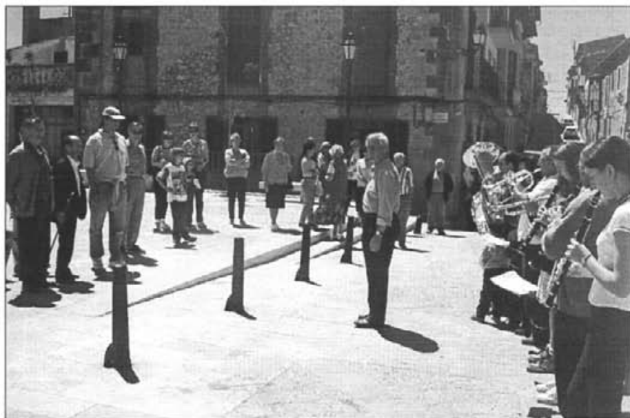
Presidint el batle del Puig, a plaça la banda tocà abans de la partida

A la sala d'actes de l'Ajuntament, dia 7 d'abril el Dr. Carlos Señor de Uria va oferir una molt documentada conferència sobre prevenció del càncer en totes les seves modalitats. El públic, que omplí la sala, va romandre molt satisfet no sols de l'exposició, sinó de saber tants de serveis com es presten.