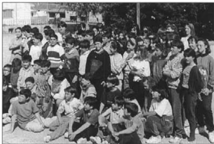
Eren alumnes l'any 1992. Ara ja tenen 20 anys i podrien glosar

La nova generació de bertsoaris —glosadors del País Basc i Navarra— i de troveros —de Múrcia— són la prova més feta de les possibilitats que ofereix l'art de la improvisació mitjançant la glosa quan s'introdueix dins les escoles.