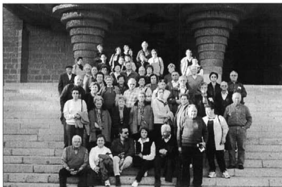
Una altra excursió de 50 montuïrers dins la programació del "Regne de Mallorca", del 16 al 19 de març passat. Els veim a Barbastro, a la residència de l'Opus Dei