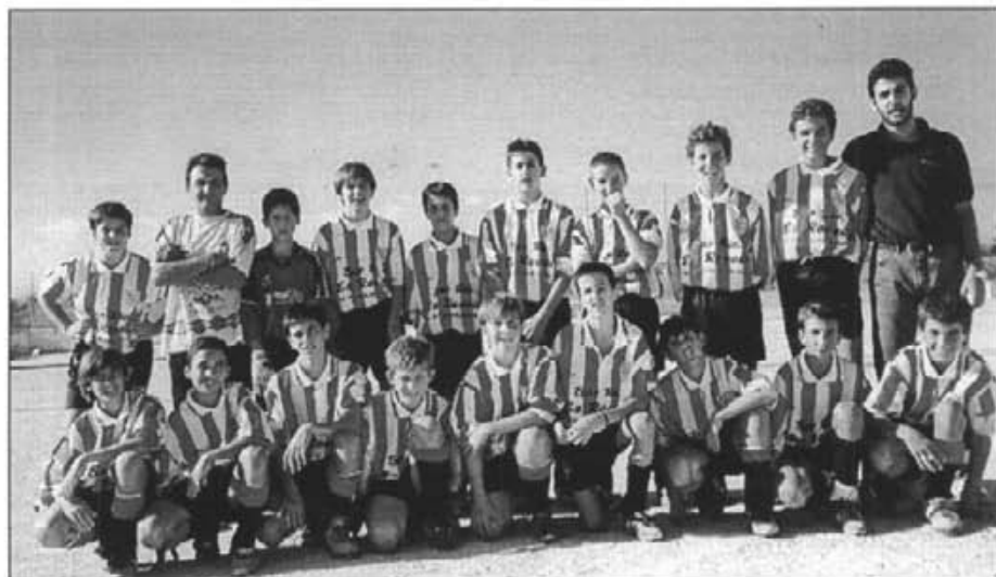
L'equip del Montuïri infantil

C. Sollerense, 1 - Montuïri, 5 Montuïri, 2 - R. Rafal, 2