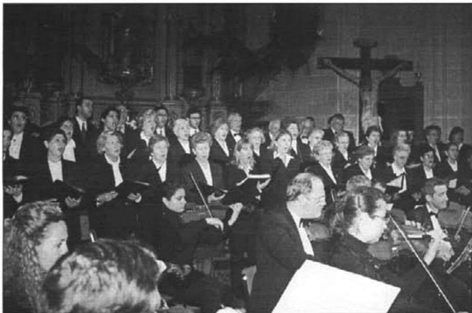
Els montuïrers poguérem gaudir satisfactoriament el dissabte del Ram d'un meravellós acte cultural, com fou el Pregó de Setmana Santa i Concert amb paraules "La Passió"