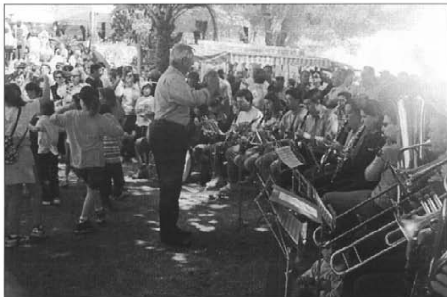
Moltes de les peces interpretades per la banda de música el dia del Puig es poden considerar revitalitzadores de la cultura popular

Si tu me vesses es cor així com me veus sa cara! No pot esser que ta mare te vulga més bé que jo! I si tu me vols bé ara, més me'n voldries llavò.