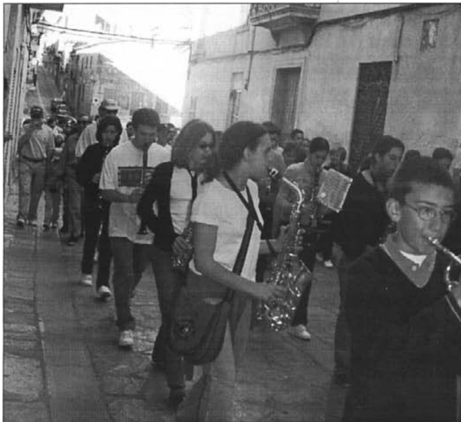
Cap al Puig

Només una mesada més tard i casualment mentre passejava per la plaça de San Marcos de Venècia, totes les campanes explotaren amb un volteig de dol. Havia mort mentre dormia aquell efímer Joan Pau I. Si fou Providència Divina o verí de monja, sempre quedarà a l'elecció del creients o no creients, però el fet cert és que aquell repicar de campanes de dol va donar pas a Joan Pau II, un dels llevats més actius que s'han covat dins la pastera de l'Església Catòlica.