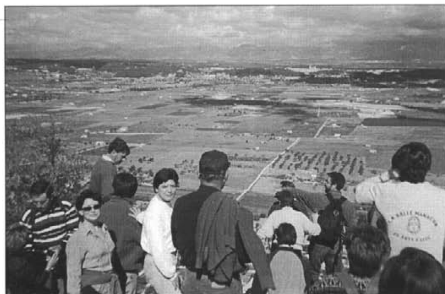
Durant tota l'excursió es pogueren contemplar sembrats i arbres amb un aspecte desagradable. En alguns ja hi ha passat la guarda d'ovelles, tant és l'eixut

El grup excursionista s'Esbart des Pla, des de la seva fundació l'any 1992, adesiara ve organitzant excursions el recorregut del qual es fa amb el cavall se Sant Bernat, o el que és el mateix: estones caminant i en estar cansats de caminar, anar a potó a peu o córrer, fins arribar a la meta que d'antuvi ens em proposat. Així, corrent i trescant, es gaudeix de la natura, es fa un poc d'esport i es passa una jornada d'esplai i germanor. Allò normal sol ésser el caminar entre