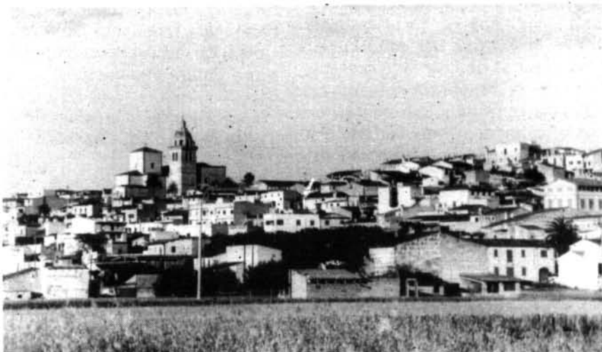
Per a la Coalició Popular, durant l'anterior legislatura, a Montuïri es va perdre una oportunitat històrica.

—Durant aquest temps d'«impasse», en què heu ajudat a l'Ajuntament?