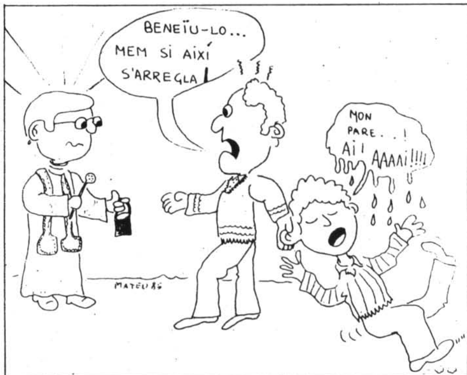
A més de les carrosses que vérem a les beneïdes de Sant Antoni, el nostre dibuixant intuí altres «benediccions», com aquesta.