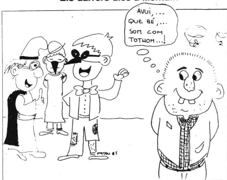
Les fresses dels darrers dies tant igualen com distingeixen a la gent.