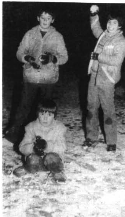
Dia 2 de gener va fer neu a Montuïri i els nins s'aprofitaren de jugar-hi. La cara d'aquests tres no pot negar la seva satisfacció.