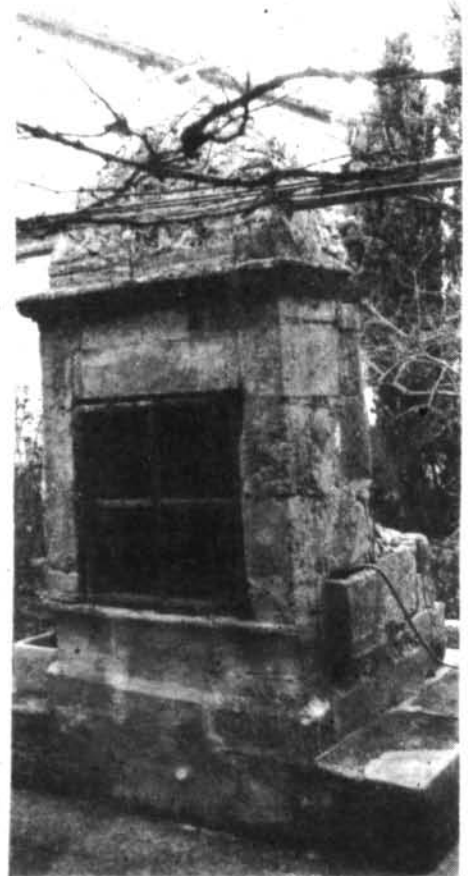
Són moltes les generacions de montuïrers que han pogut contemplar aquest pou de la Rectoria.