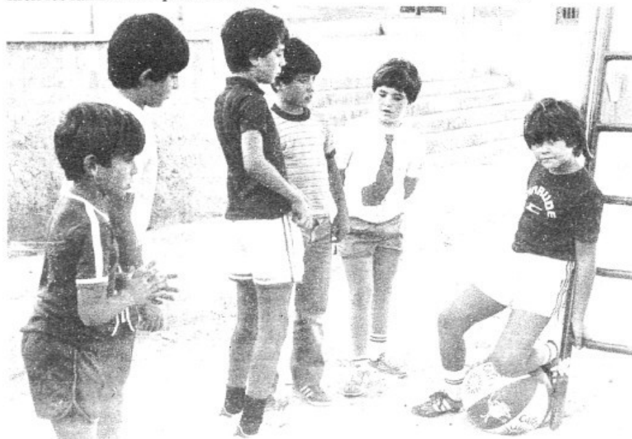
Pocs dies abans del 17 de setembre: Els nins comencen a replegar els jocs i a preparar-se per anar a escola.