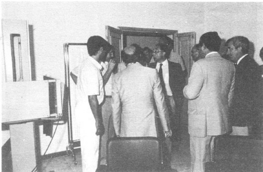
Era el dia de la inauguració: Les autoritats elogiaven el nostre Centre Mèdic i les seves instal·lacions.

Per part nostra, estem oberts a tots els suggeriments i esperem que aquesta satisfacció que ara compartim, serveixi per a una bona col·laboració entre la gent de la vila i els professionals sanitaris. Només d'aquesta manera podrem tenir èxit en l'aspiració d'un augment de la qualitat de vida per a tots, que és una motivació permanent que mou a tota comunitat humana.