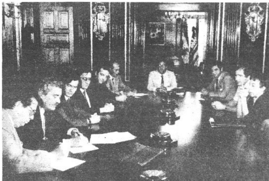
En el Govern Civil es firmà el préstec de 6 milions per a Montuïri. Entre els assistents hi figurava, naturalment el nostre Batle.