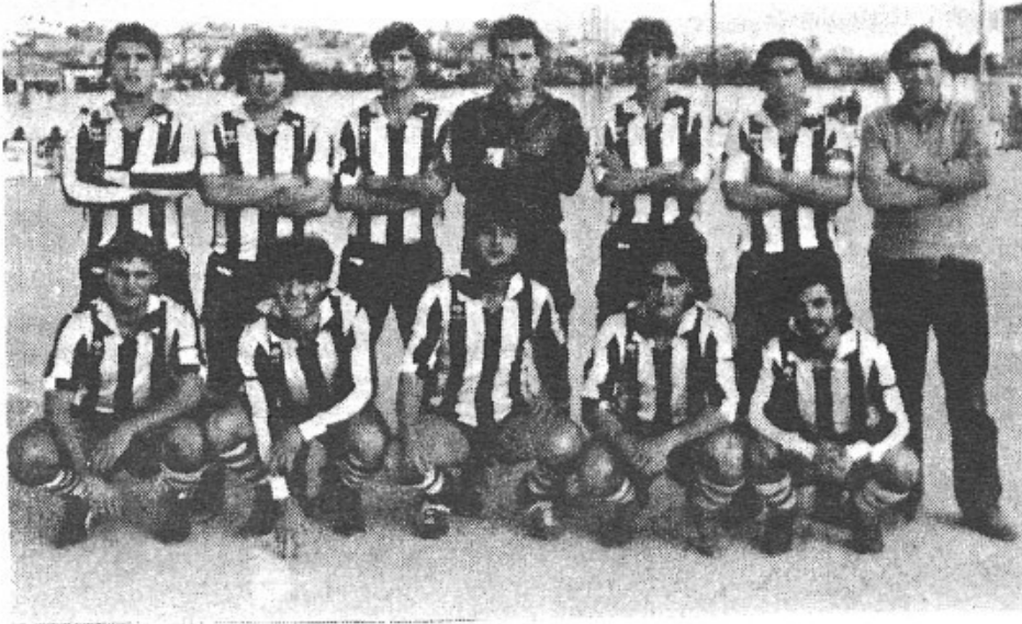
(Ve de la 6.ª pàg.)

—S'han fet comentaris de què juguen molts de jugadors d'altres pobles. Què opines damunt aquest tema?