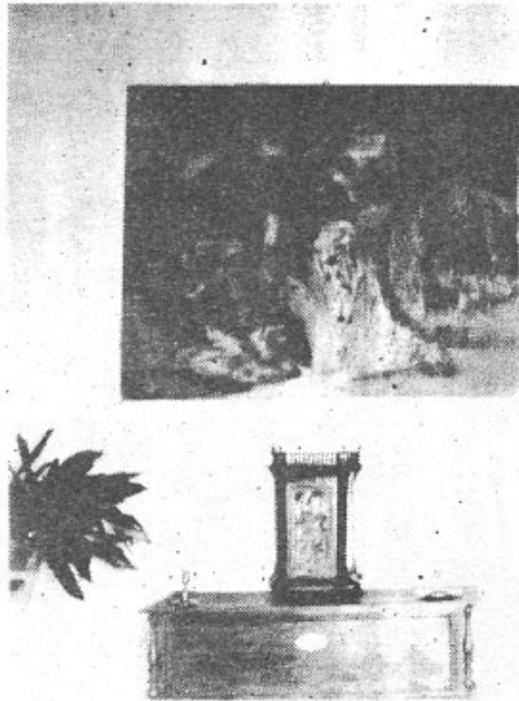
Entrada principal de la Rectoria vista des del portal del jardí. A l'esquerra podem contemplar una sarja del segle XVI, una caixa típica i damunt d'ella una imatge del Nin Jesús de Praga dins un armari artístic amb aires renaixentistes (segle XIX).

Endemés de les misses dels diumenges al Puig de St. Miquel, cada dia, un quart abans de la missa del vespre tindrèrem la pregària en memòria de la Verge Maria, en el mes de maig, temps Pasqual.