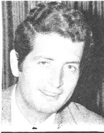
L. AVIARI DE L'ESCOLA

— La cooperativa de producció possibilita millors vendes i productes. Elimina els beneficis dels intermediaris, a vegades, més grossos que els dels pagesos.