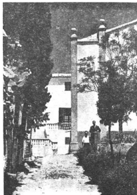
○ Guillem Pascual a l'arribada del camí vell, davant la capella del Puig

Cal afegir que la totalitat de les despeses invertides en la carretera del