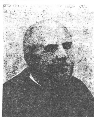
HOMENATGE AL RECTOR RUBI

(De la carta del Papa «L'home amb el seu treball»)