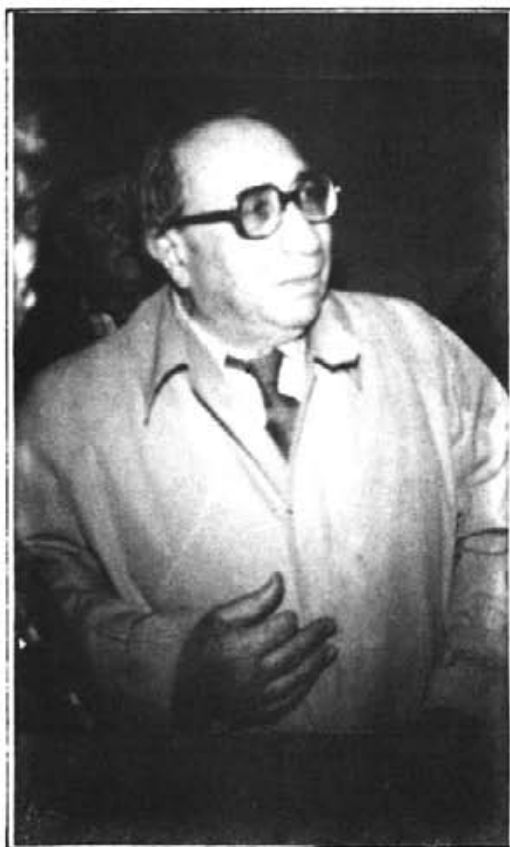
Giovanni Lilliu inaugura l'exposició de Monuments Arqueològics d'Artà

dental. Aquesta importància es manifesta per la datació i classificació de la prehistòria mallorquina i l'estudi, per primera vegada, a Ses Païsses , del nivell del sòl/terreny i de la morfologia i configuració del talaiot.