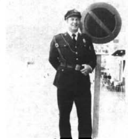
El Municipal PIRIS recentment jubilat

B.- Estàs content dels teus companys de feina?. T'han fet bona despedida?.