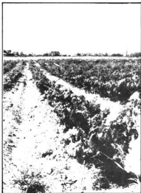
Malgrat el progressisme i els temps moderns, a la Colònia continua havent-hi "vinyes verdes vora el mar" com canta En Lluis Llach