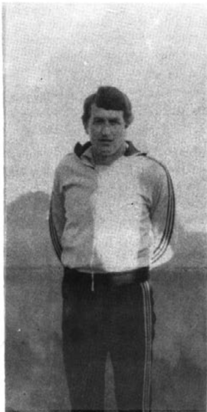
Otra vez en la brecha

El día de Reyes, se caracterizó por uno de los mejores encuentros de la presente temporada. Acudía a Ses