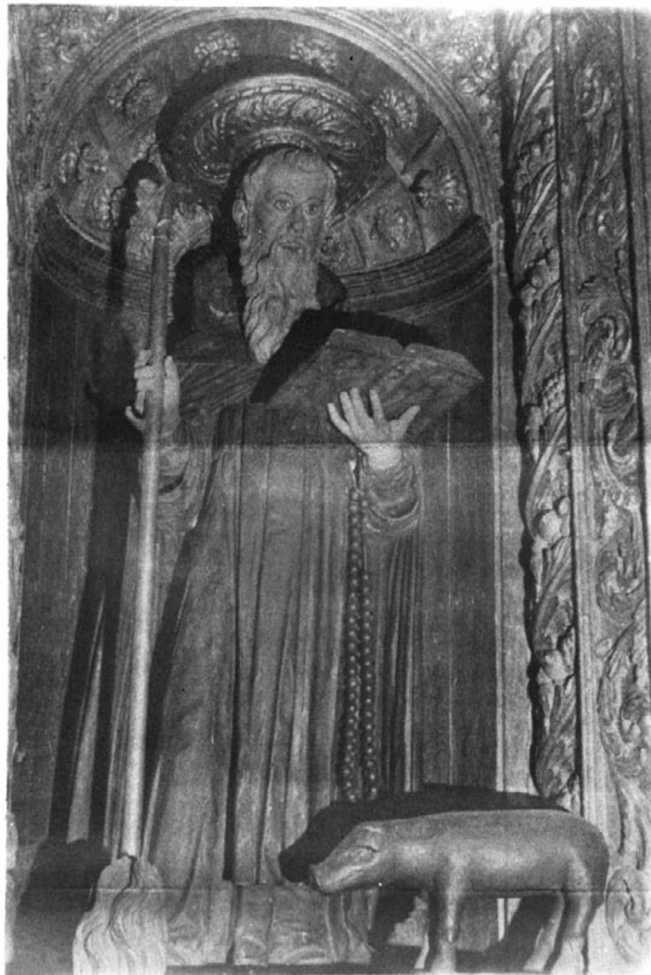
Sant Antoni venerat al temple parroquial d'Artà.