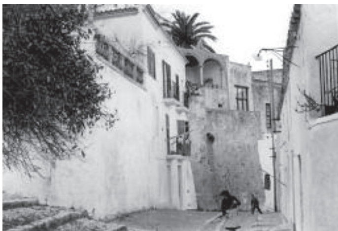
El carrer de Sant Carles a Dalt Vila, fotografiat per Marià Villangómez. En aquest racó de Dalt Vila es troba la casa familiar coneguda com Can Villangómez . AISME

La principal anècdota del dia, degudament recollida per la premsa local, va ser protagonitzada per dos homes que varen caure a l'aigua a la zona del moll de la ciutat a causa de la manca d'enllumenat públic, en contrast amb altres barris que sí que en tenien, com ara Dalt Vila i l'Eixample. Anys després el poeta dedicaria alguns dels seus versos - Poemes del port -, a aquesta zona per on va passejar tantes vegades.