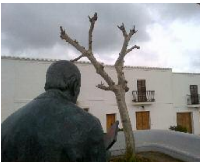
Estàtua de Marià Villangómez al poble de Sant Miquel.

Tot i que la seva carrera com a docent s'inicià a Palma l'any 1942, cinc anys abans, en plena Guerra Civil ja s'havia batejat