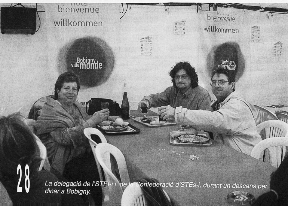
La delegació de l'STEs-i i de la Confederació d'STEs-i, durant un descans per dinar a Bobigny.

Enfront d'aquesta situació que es va agreujant cada vegada més, hem d'oposar una resistència que ha de passar, en primer lloc, per difondre i donar a conèixer el que ja està ocorrent en països veïns com Anglaterra, on la privatització i mercantilització de l'ensenyament està portant conseqüències nefastes per a tota la societat, i per exigir que l'educació sigui tractada com un dret i no com un negoci. Per a això, s'imposa l'exigència de la derogació de les tres lleis educatives en vigor a l'Estat espanyol i el compromís de totes les forces socials i polítiques que en el seu moment es varen oposar a la LOU, la llei de FP i la LOCE.