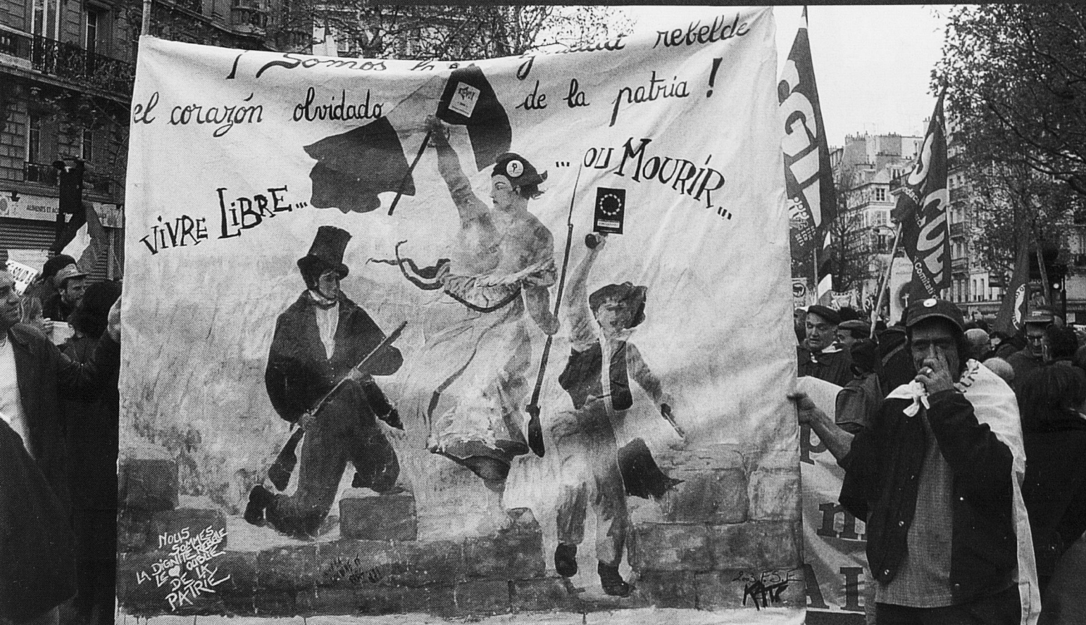
Un moment del desenvolupament de la manifestació a París.