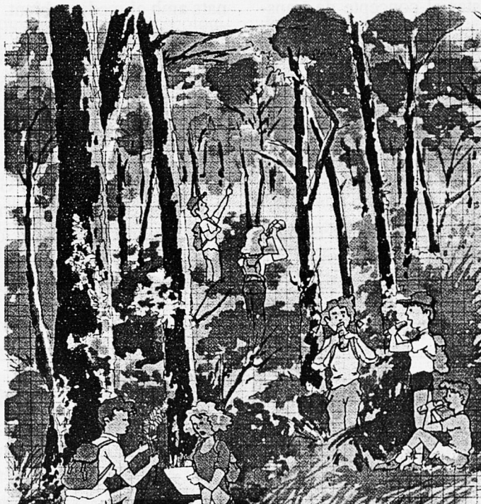
Dibuix extret de "Gaudeix del bosc!", de la Conselleria de Medi Ambient

paraules com sostenibilitat, sobreexplotació, gestió dels recursos..., apareixen en titulars, estan de moda i són una demanda social que ha de ser tractada a l'escola. Els centres docents no es poden allunyar, deslligar de la realitat de l'entorn. El nostre alumnat ha de saber quines són les problemàtiques que implica viure en un territori de dimensions limitades, dels recursos de què disposem, l'ús que es fa de l'aigua, de les energies..., però també ha de gaudir del privilegi del nostre