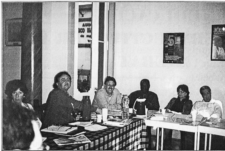
Una sessió de treball del seminari

1. La introducció ve a ser una reflexió sobre la problemàtica educativa mundial. Les preguntes que sorgeixen són: en quina mesura les orientacions de l'actual mundialització impacten en els processos educatius nacionals i internacionals i quines direccions la transformen als efectes de les funcions que hagi de complir. Com l'educació pot jugar un paper en el desenvolupament d'una mundialització alternativa, basada en la igualtat, en la solidaritat i en el reconeixement mutu i democràtic de les diversitats nacionals i culturals.