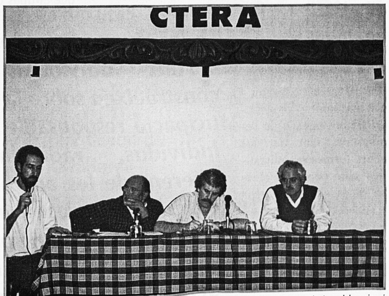
Un moment de les conclusions del seminari