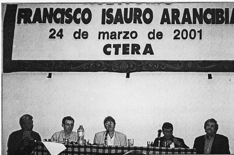
La clausura del Seminari

que permeti actuar sobre la cultura per a la democràcia i la mobilització social; vincular l'escola amb la comunitat i amb altres espais amb què es puguin crear noves xarxes socials que articulen accions educatives; incloure els moviments socials com a agents educadors de ruptura amb els esquemes tradicionals de la cultura escolar; atorgant d'aquesta manera importància a l'educació no formal; afirmar la necessitat de debatre i consensuar una ètica de