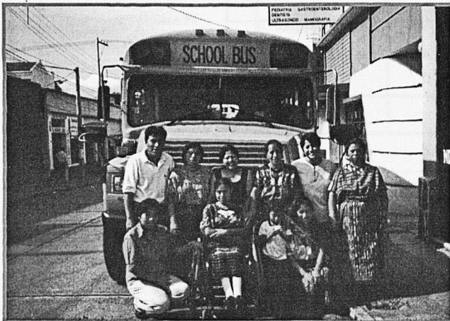
Autobús per a la guarderia Josefa Ixcoly