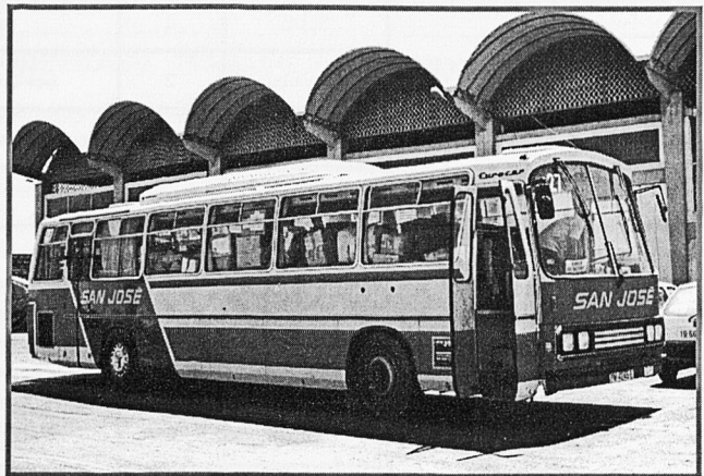
Autobús Biblioteca cap a Hondures

Aprofitant l'enviament del vehicle, l'STEI-i va realitzar una campanya de recollida de material didàctic als centres educatius de les Illes; així es van poder enviar 30 equips informàtics complets i un laboratori d'idiomes per muntar dues aules de formació. L'espai lliure que va quedar de l'autobús es va completar amb més de 100 caixes de llibres classificats per dotar-lo com a biblioteca, també es van enviar caixes de material didàctic, cinquanta màquines d'escriure,