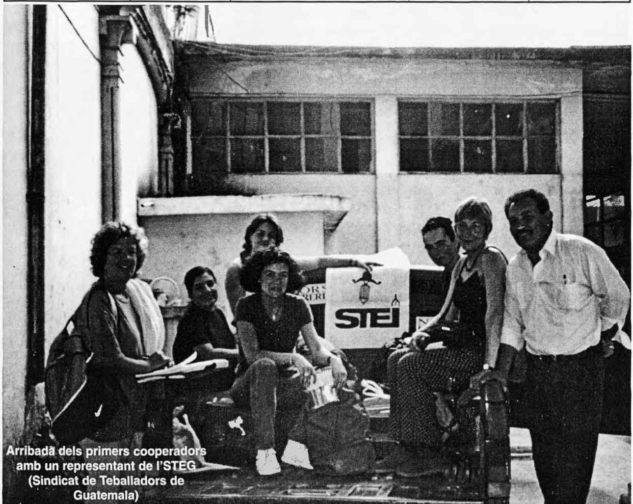
Arribada dels primers cooperadors amb un representant de l'STEG (Sindicat de Teballadors de Guatemala)