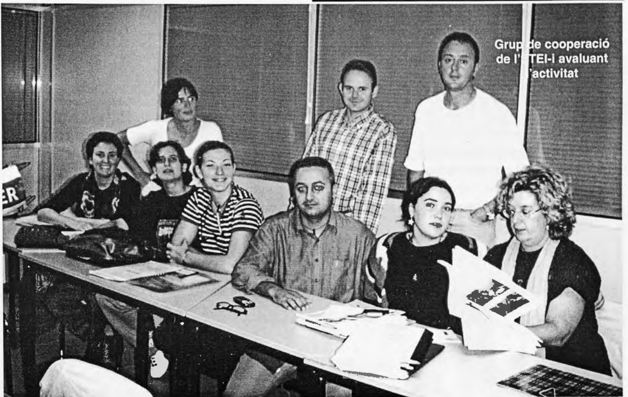
Grup de cooperació de l' STEI-i avaluant l'activitat