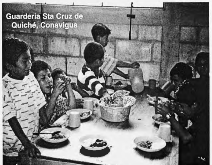
Guarderia Sta Cruz de Quiché, Conavigua