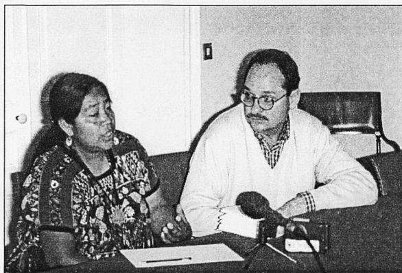
Roda de premsa a Mahó.

L'ex Vicepresidenta del Congrés ha assegurat que en el seu país no hi ha consciència del que significa el poble indígena, que representa el 60% de la població, i que no es respecten els acords pel que fa referència a aquest important col·lectiu. "En el meu país es creu que poder votar és democràcia; quan nosaltres creim