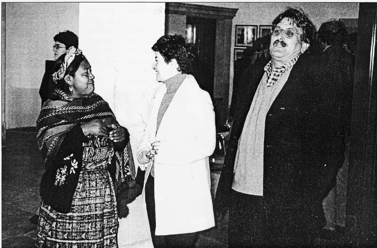
Acte d'inauguració de l'exposició "Una mirada a Centreamèrica".

que és la pluriculturalitat i el respecte a la visió dels indígenes. La participació indígena en el Congrés no supera el 10% i en altres organismes és nul·la, ja que l'Estat mantén una actitud tancada a la participació indígena en les institucions", afirmà Tuyuc. □