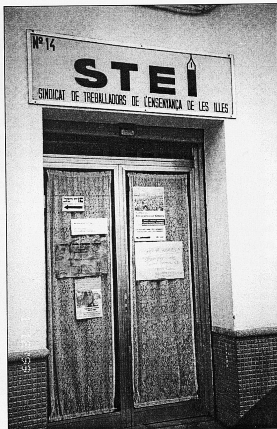
De l'històric "Vinyassa, 14", ...