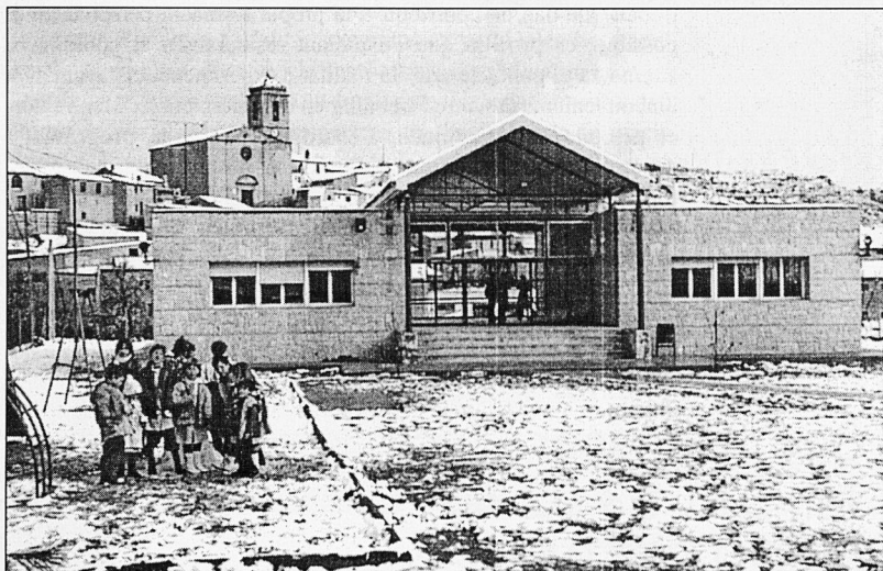
Escola rural dels Omellons (Les Garrigues).

És important que per dur endavant aquest projecte comú de Zona es pugui comptar amb coordinacions de diferents aspectes en l'àmbit de la zona.