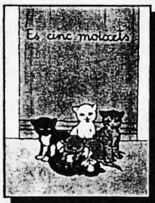
EDUCACIÓ PRIMÀRIA Iniciació a la lectura DE MICA EN MICA Sèrie de vint llibrets de lectura progressiva. Text de Ramon Bassa Dibuixos d'Aina Bonner

ALTRES LLIBRES DE LECTURA: Col·leccions Alxò era i no era, Titelles, Tirurany i Sol Alt