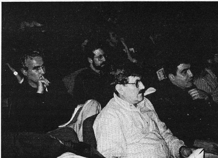
Representants de l' STEI

d'Economia de Castilla-La Mancha, a més dels tècnics de la nostra Confederació. □