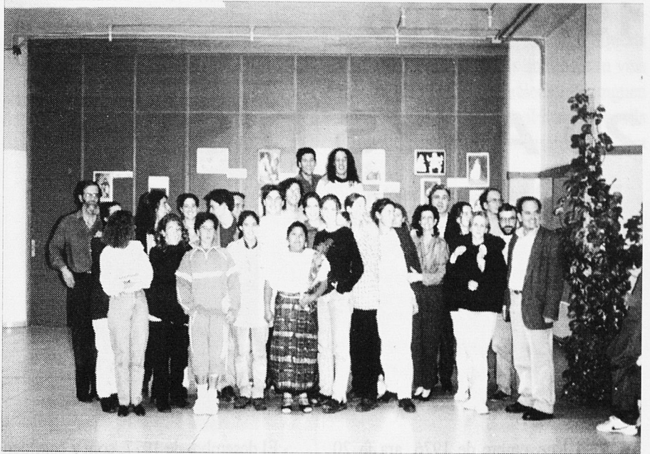
Amb professors i alumnes de l'IB Joan M. Thomàs

davant: contribuir que la base que ens donen els Acords de Pau sigui el primer d'una sèrie de passos per aconseguir major participació de les dones. Les nostres perspectives són ajudar en la construcció d'una nova societat, més justa, més equitativa, amb democràcia real, sense militarisme,