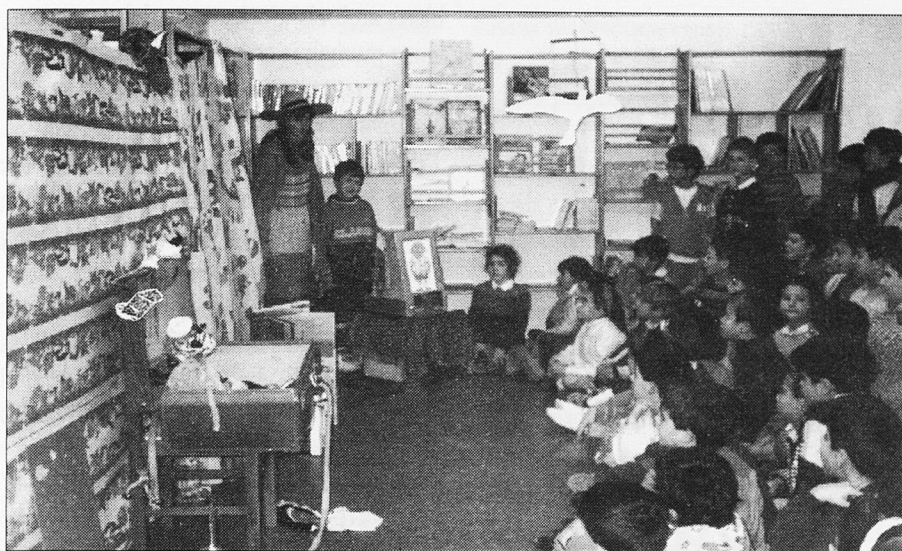
La narració del conte es seguida amb evident interès

material estès, resultat d'una situació sorpresiva.