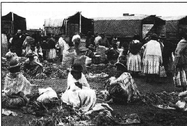
Mercat bolivià de verdures

«Jo vull seguir essent rebel, vull seguir somiant amb un futur lluminós per als pobles del món i especialment per als pobles indígenes que lluiten pel respecte dels seus drets específics i els seus valors milenaris»