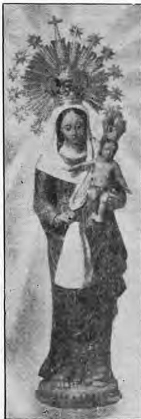
Nuestra Señora de la Trapa