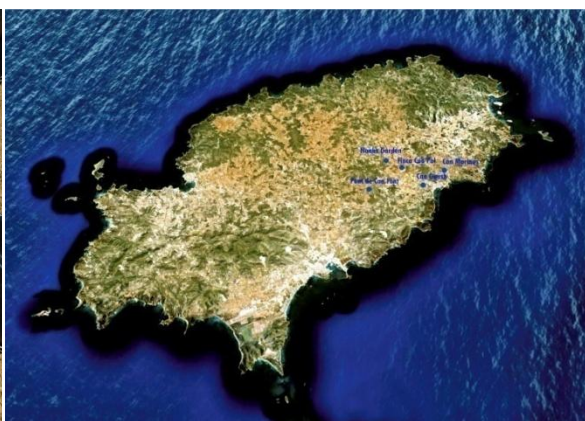
Fig. 4. Ubicacions de les trampes a l'illa d'Eivissa.