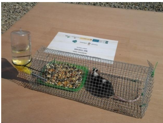
Fig. 1: Gàbia amb el ratolí viu, que es col·loca a l'interior de la trampa.

Degut a la mortalitat massiva dels ratolins, després de la primera setmana es va deixar d'utilitzar l'animal viu com a esquer en aquest tipus de trampa, tanmateix es va mantenir el cadàver per provar-lo com a mètode d'esquer.