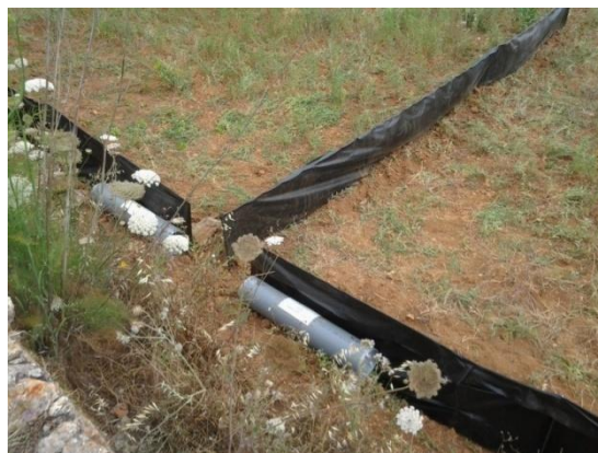
Fig. 2: Trampes de doble embut amb utilització de malles de desviament.