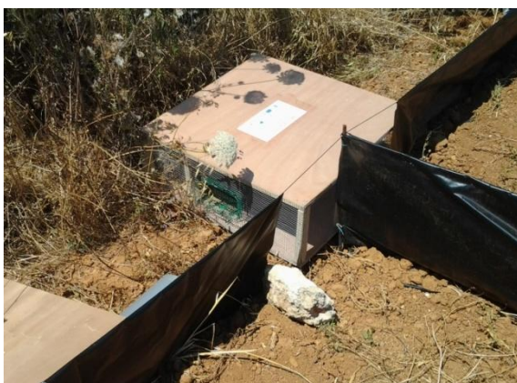
Fig. 3. Trampa tipus caixa amb malles de desviament.

Les ubicacions de les trampes (Fig. 4) coincideixen normalment amb els viviers dels quals se sospita que poden ser les fonts d'entrada dels ofidis, a les rodalies de les zones abans esmentades, sempre seguint consells i recomanacions d'experts en quant a les condicions d'ombra / sol, humitat, vegetació, murs, etc.