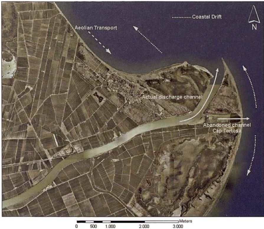
Fig. 2. Descarga actual y distribución de sedimentos. Fig. 2. Present river mouth system and sediment drift.

sobre las dunas costeras de la Flecha del Fangar y playa de la Marquesa (Serra et al. , 1997), no así en el hemidelta sur donde la dirección dominante provoca un transporte hacia mar. Estos vientos son los que presentan mayor intensidad y frecuencia, y soplan desde octubre a febrero, siendo en parte los responsables de la distinta configuración y comportamiento evolutivo de los dos hemideltas. De febrero a octubre dominan los vientos más moderados del SO, que modelan principalmente las dunas poco desarrolladas del hemidelta sur.