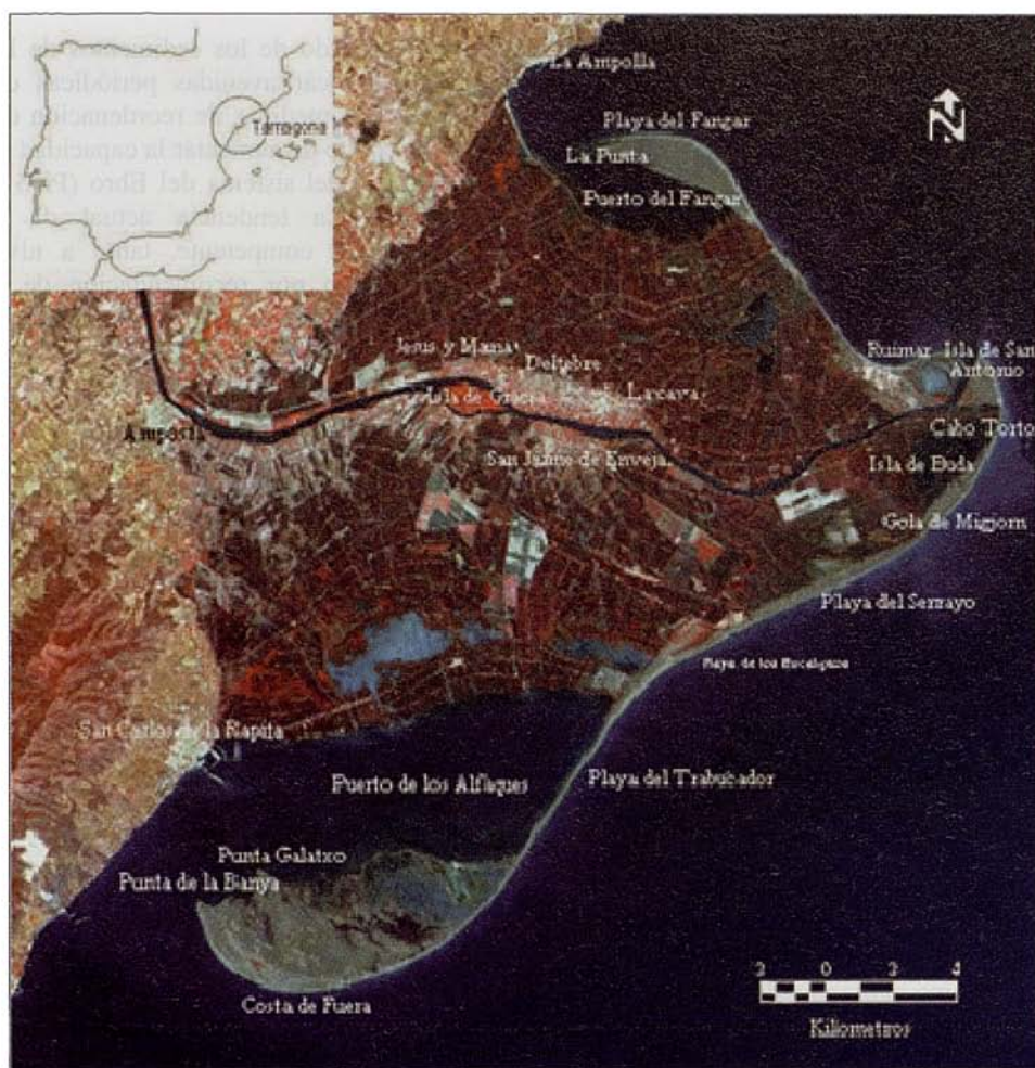
Fig. 1. Situación del Delta del Ebro y configuración morfológica. Fig. 1. Ebro Delta: location and morphology.

unos 200 m de anchura. Los principales sistemas dunares que existen en la costa deltaica se encuentran precisamente en estas tres zonas (además de las existentes en la playa de Riudar, próxima a la desembocadura, en el hemidelta norte) quedando activo únicamente el sistema del Fangar.