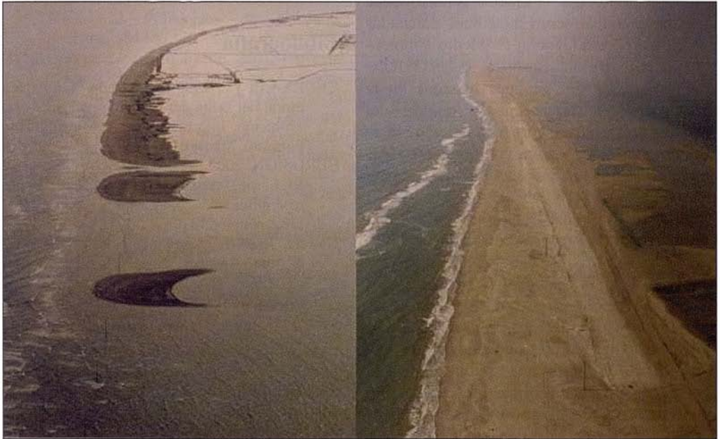
Fig. 4. Barra del Trabucador. Izq.: después del temporal (1990). Der.: Periodo de calma, donde se observa la última aportación de arena (franja más clara interna) y la presencia de fan deltas en la parte interna (MOPT, 2005).

Existen diversas propuestas de actuación por parte del Ministerio de Medio Ambiente (Galofré, 2007) en zonas donde la erosión es muy intensa, como es el caso propuesto entre la Flecha del Fangar y la Playa de La Marquesa (Ministerio de Medio Ambiente, 2001). Esta actuación pretende reproducir artificialmente el cordón litoral, tal como era el sistema previo al retroceso, a una cierta distancia de la línea de costa actual (500 m) para limitar las inundaciones por temporal. Al mismo tiempo se sustraería parte de la arena que actualmente llega a la punta de la Barra del Fangar, disminuyéndose el proceso de cierre de aquella bahía. Estas medidas serían parecidas a las comentadas anteriormente para el mismo sector, en la que se proponía utilizar la propia energía del medio para conseguir reforzar el cordón litoral.