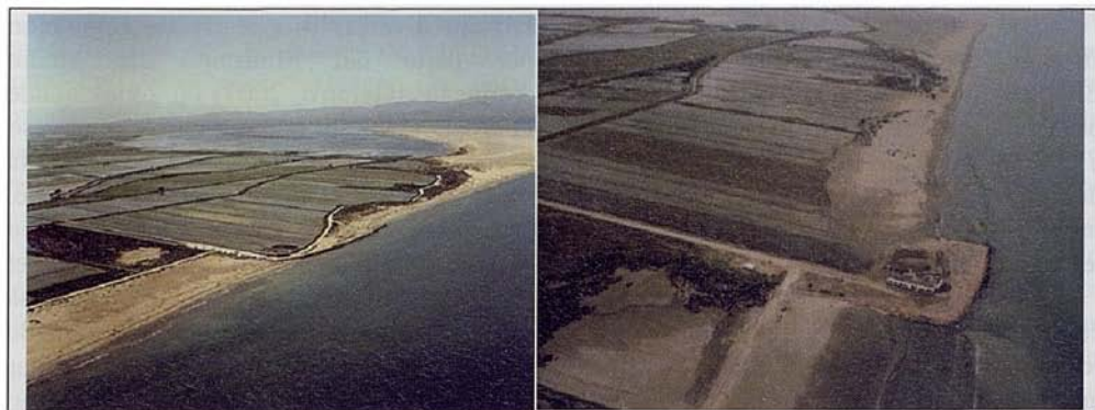
Fig. 5. Playa de la Marquesa (Restaurante Los Vascos) junto al inicio de la península del Fangar (izquierda, año 2002 y derecha, 2008)

Fig. 5. Marquesa Beach (Los Vascos Restaurant) just at the start of Fangar Spit (left: 2002, right: 2008).