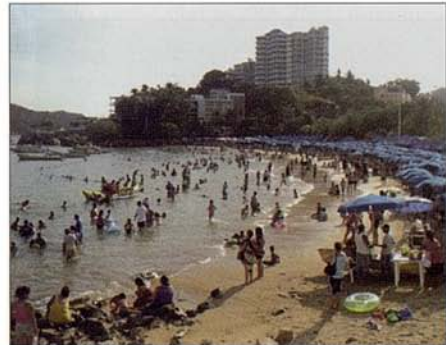
Fig. 4. Playa Caleta (ACA) durante vacaciones de semana santa 2011.

Hace referencia a la actitud que tienen los usuarios por el recurso playa: hábitos, actividades en el lugar y preferencias.