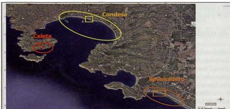
Fig. 2. Mapa de ubicación bahía de Santiago y transectos de muestreo.

Fig. 1. Map of Santiago Bay and sampling transects.