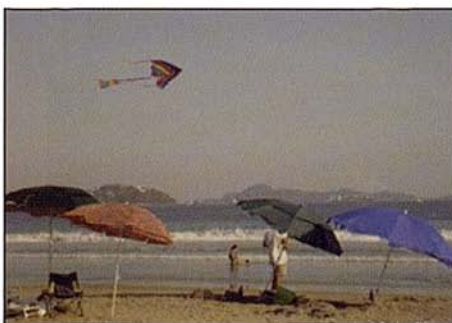
Fig. 5. Distintas actividades recreativas en la playa Olas Altas (MZO).

Fig. 5. Some recreational activities on the Olas Altas beach (MZO).