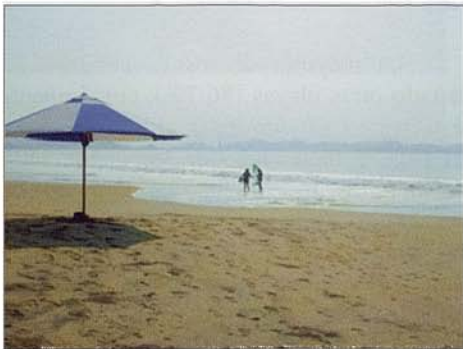
Fig. 9. Playa Miramar (MZO). Fig. 9. Miramar beach (MZO).

Los resultados nos indican que la percepción de los usuarios en MZO y ACA muestra un patrón similar en cuanto a la evaluación de la playa (deficiencias) y demandas para su mejoramiento; tales como la limpieza de la playa, aumento en depósitos de basura y mejoramiento en la calidad de los accesos.