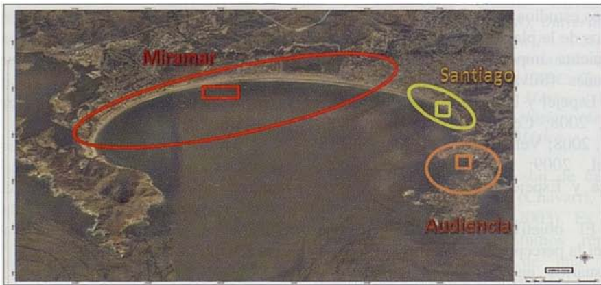
Fig. 1. Mapa de ubicación bahía de Santiago y transectos de muestreo.

mero de encuestas necesarias para obtener una opinión representativa se determinó mediante una prueba estadística aplicada por Cervantes (2008) y que ha sido utilizado en otros modelos de evaluación integral de playas (Espejel et al. , 2006; Velázquez, 2006; Ferrer, 2008). El universo encuestado consistió en personas de ambos sexos, de 15 a 85 años de edad que se encontraban en la playa. Posteriormente se diseñó la base de datos con el uso del programa estadístico SPSS® Versión 19.0 (Statistical Package for the Social Science).