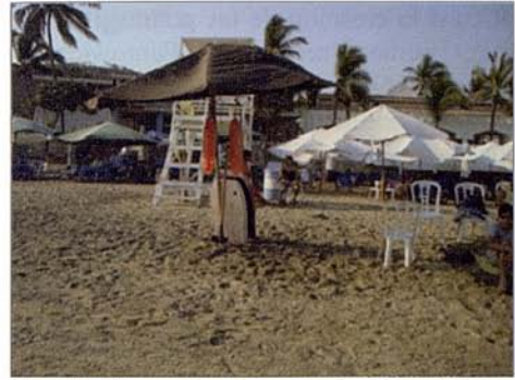
Fig. 8. Torre salvavidas de la playa Miramar (MZO). Fig. 8. Lifeguard Tower in Miramar beach (MZO).

En ambos sitios más de la mitad (88.2%) de los encuestados, opinó que no existen suficientes botes para depositar la basura; no obstante expresaron que al retirarse la llevan consigo para disponerla adecuadamente (Fig. 6).