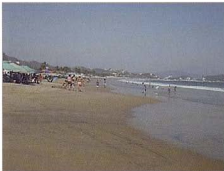
Fig. 3. Playa Miramar (MZO) durante el verano del 2011.

Fig. 3. Miramar beach (MZO) during the summer 2011.