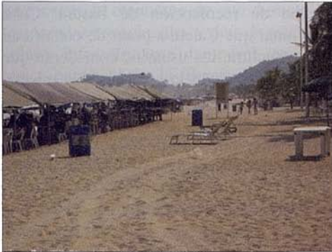
Fig. 7. Playa Condesa (ACA). Fig. 7. Condesa beach (ACA).