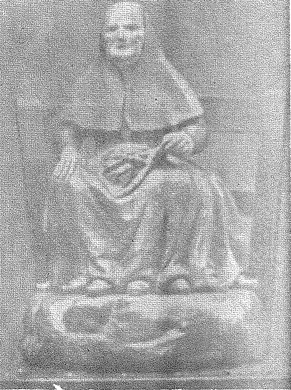
Alegoría de la Penitencia, probable fuente iconográfica de la Cuaresma mallorquina, según la Iconología de Cesare Ripa.

Version mallorquina de la Cuaresma. lábrada en madera. Paradero desconocido.