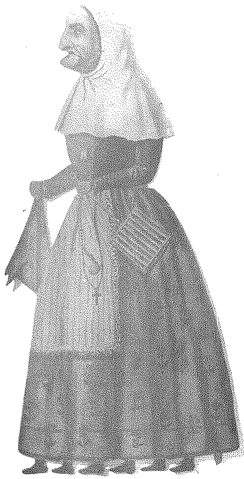
La Cuaresma en una versión mallorquina del siglo XIX. Museo de Santa María del Camí, Mallorca. (Foto Jerónimo Juan).