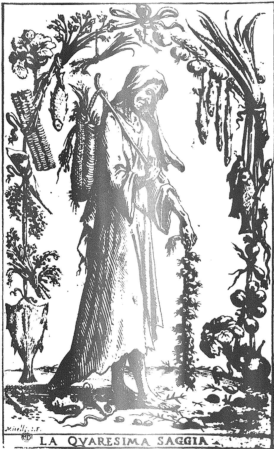
La Cuaresma, personificación italiana del siglo XVII.