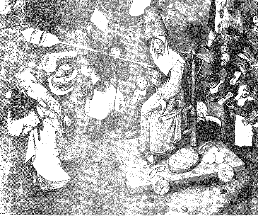
La Cuaresma según una versión menorquina reciente.