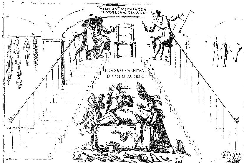
El aserrado de la Cuaresma según el italiano I. F. Mitelli, siglo XVIII. Gabinetto Nazionale delle Stampe, Roma.