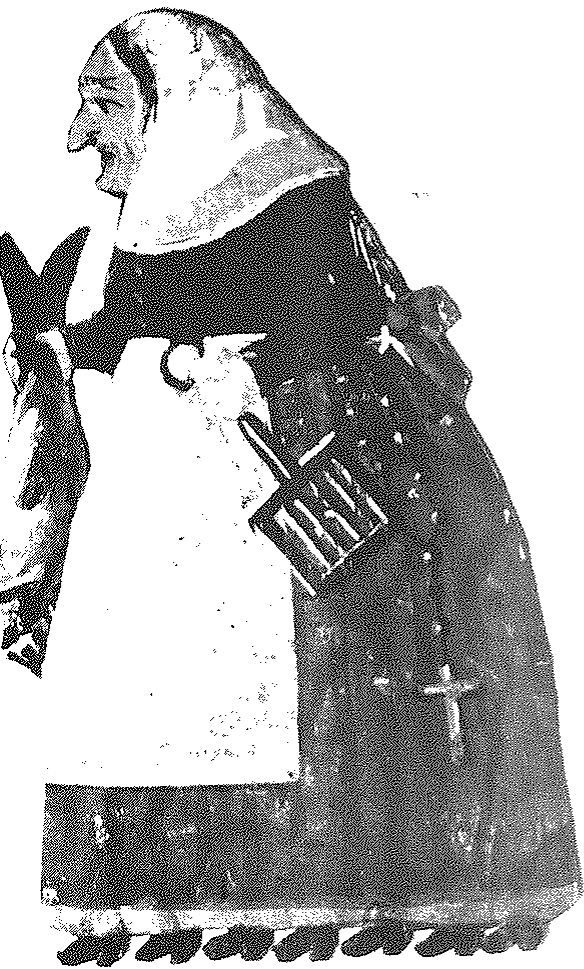
La Cuaresma, en su versión mallorquina. Dibujo coloreado del siglo XIX. Col. Costa, Barcelona.