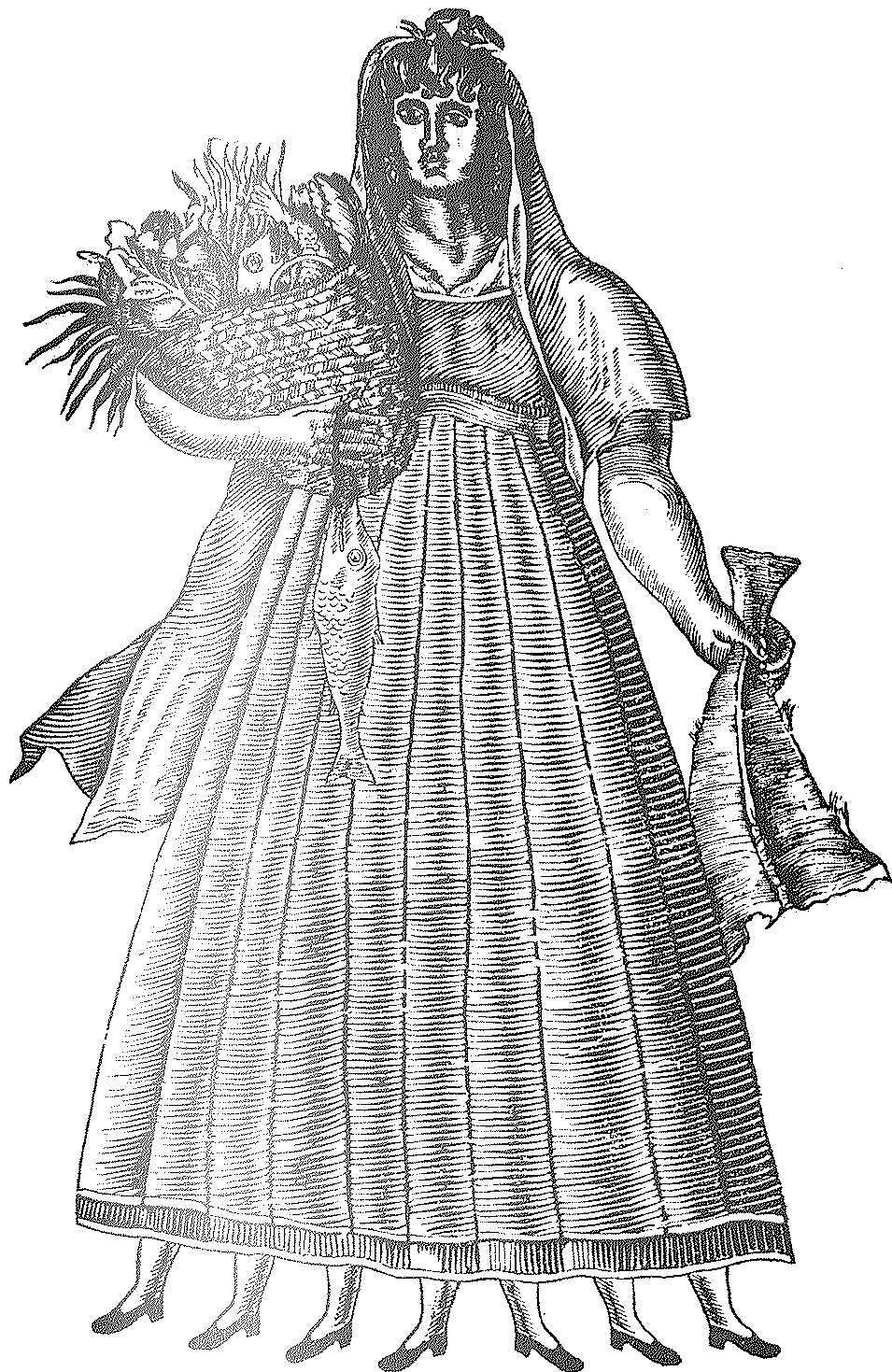
La Cuaresma, personificación catalana, de fines del siglo XVIII. Grabado del Instituto Municipal de Historia de Barcelona.