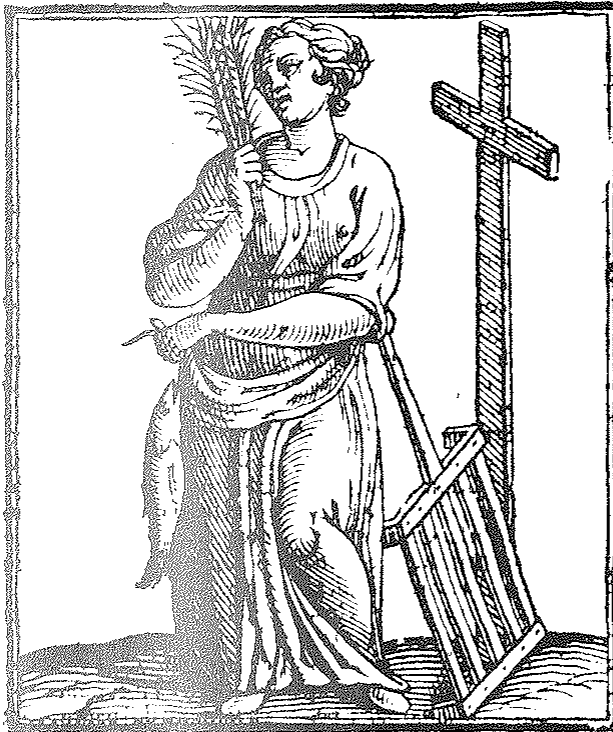
La Cuaresma, según Pieter Brueghel (1554).